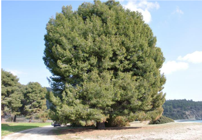
Сосна алеппская ( Pinus halepensis )