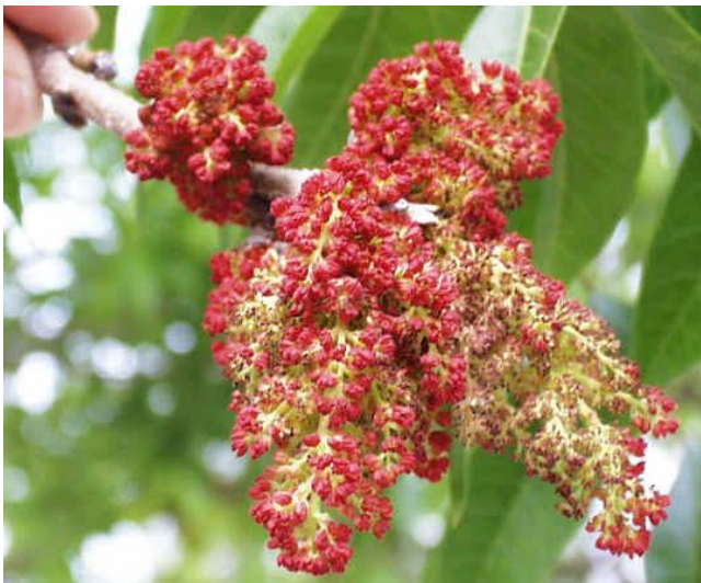
Ладанник (лат. Cistus )