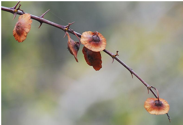
Держи-дерево, или христовы тернии ( Paliurus spinachristi )