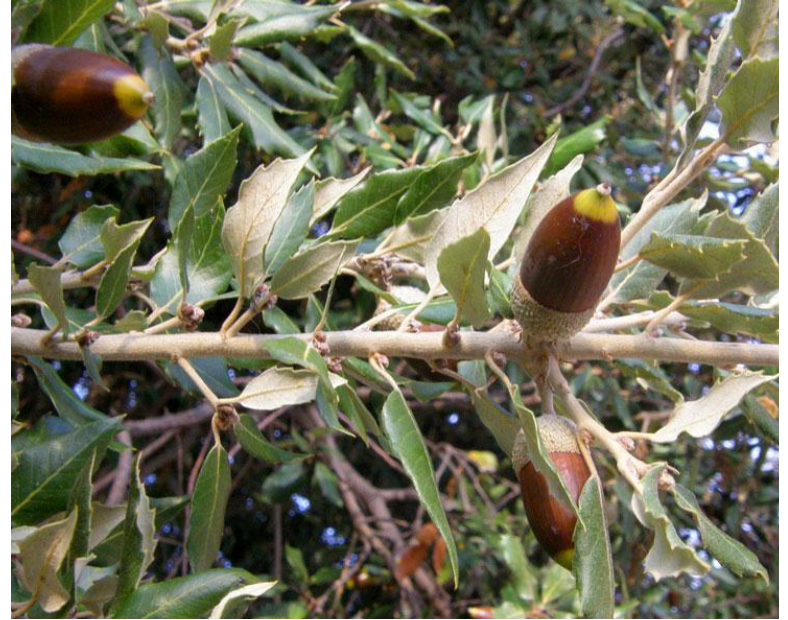
Дуб каменный (Quercus ilex)