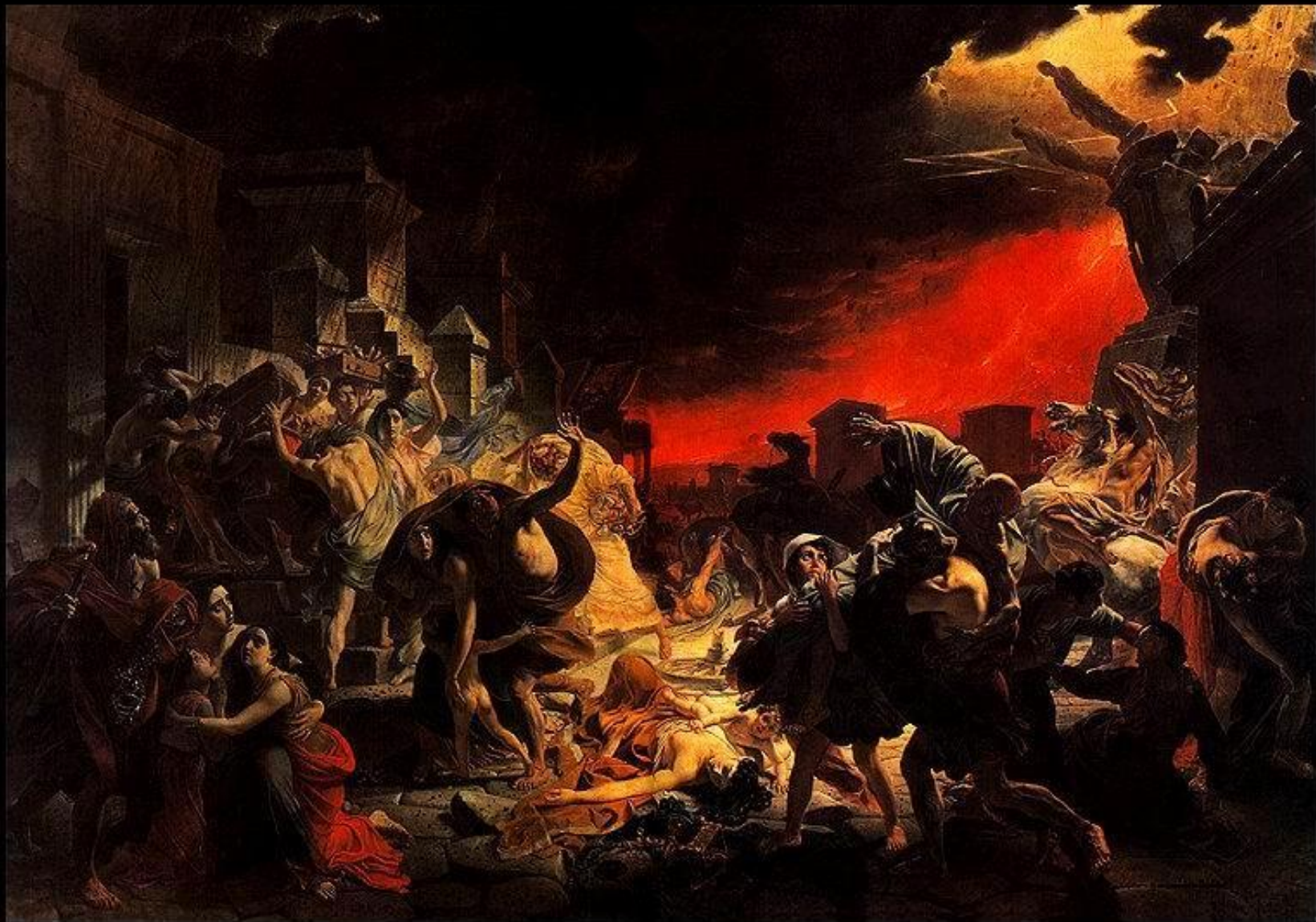
Брюллов К.П. "Последний день Помпеи". 1833 холст, масло. ГТГ