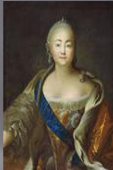
ЕЛИЗАВЕТА Дочь Петра I