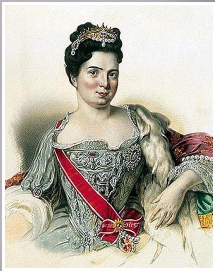
ЕКАТЕРИНА Жена Петра I