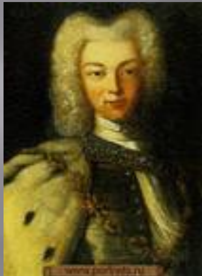
ПЕТР Внук Петра I