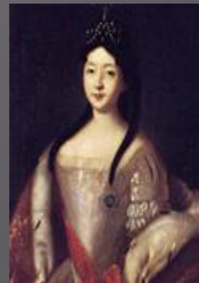
АННА Дочь Петра I