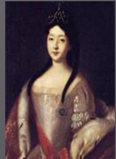
АННА Дочь Петра I