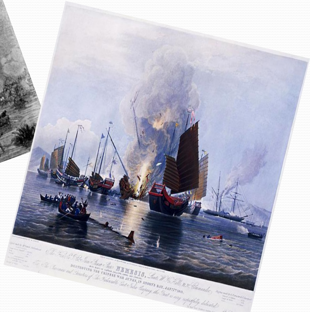
The Battle of the Iron Clads, in the Bay of Anson's Bay, Jan 17th 1861. WITH DEPTHS OF WATER CAPABLE OF TAKING THE SHIP. DESTROYING THE CHINESE WAR JUNKS, IN ANSON'S BAY, JAN 17th 1861. The American and British of the Franklin and the Taylor, who captured the Junk is very respectfully delivered.