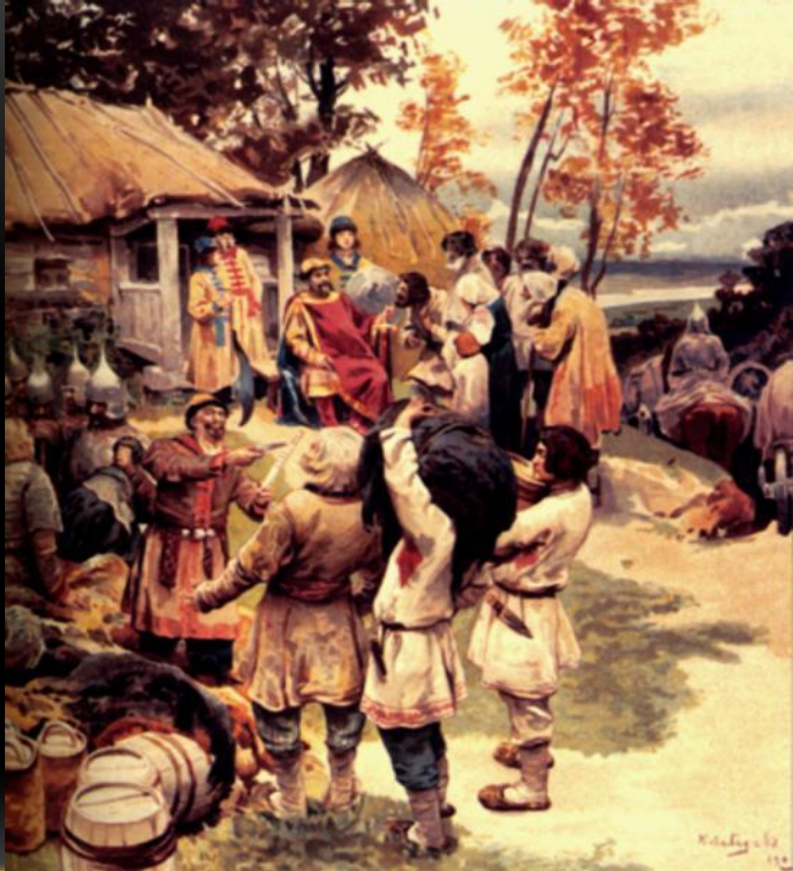
Сбор дани на Руси - полюдье