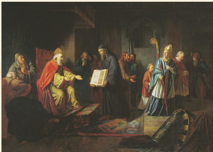
Великий князь Владимир избирает религию И.Е.Эггинк