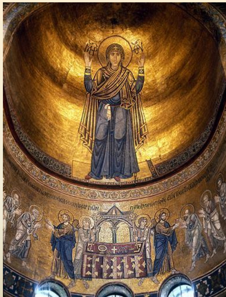
Богоматерь Оранта. Мозаика.

Софийский собор в Киеве украшают удивительные мозаики, самой знаменитой из которых является изображение Богоматери Оранты.