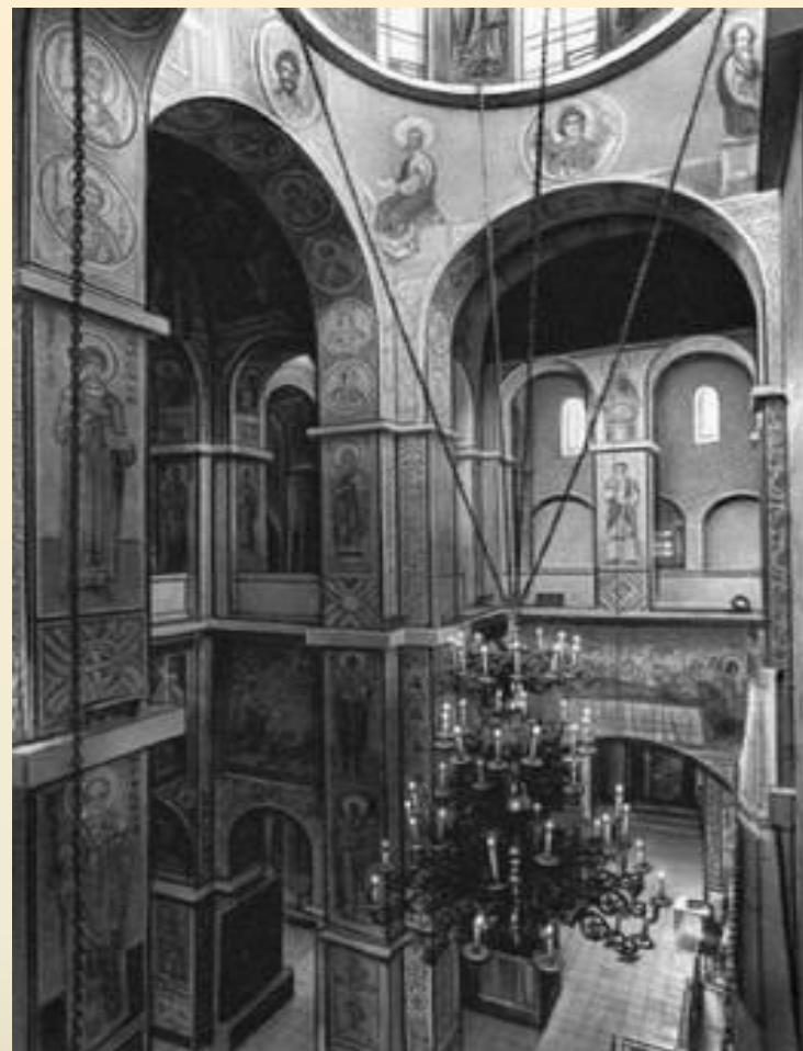
Софийский собор в Новгороде

По примеру Киева в 40-е — 50-е годы XI века были построены Софийские соборы в Новгороде и Полоцке. Дошедшая до нашего времени София Новгородская намного строже и монументальнее киевского собора — гармоничная византийская традиция ощущается здесь намного слабее. Новгородская архитектура, в отличие от киевской, не знает мозаики — Софию Новгородскую украшали только фрески.