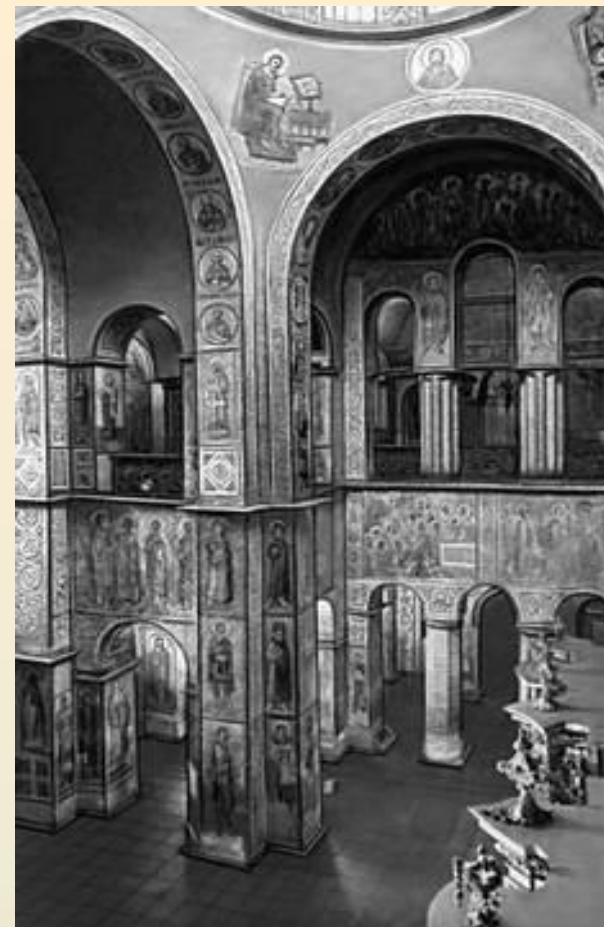
Софийский собор в Киеве, 1037г.