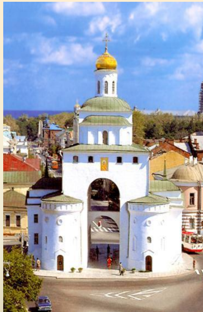
Золотые ворота в Киеве

Нам известны древнерусские произведения не только церковной, но и светской архитектуры. Судя по летописным известиям, каменные палаты строились для князей еще в языческую эпоху — археологические раскопки подтверждают эти сведения. Однако до нас дошли постройки уже XI века — прежде всего это Золотые ворота в Киеве.