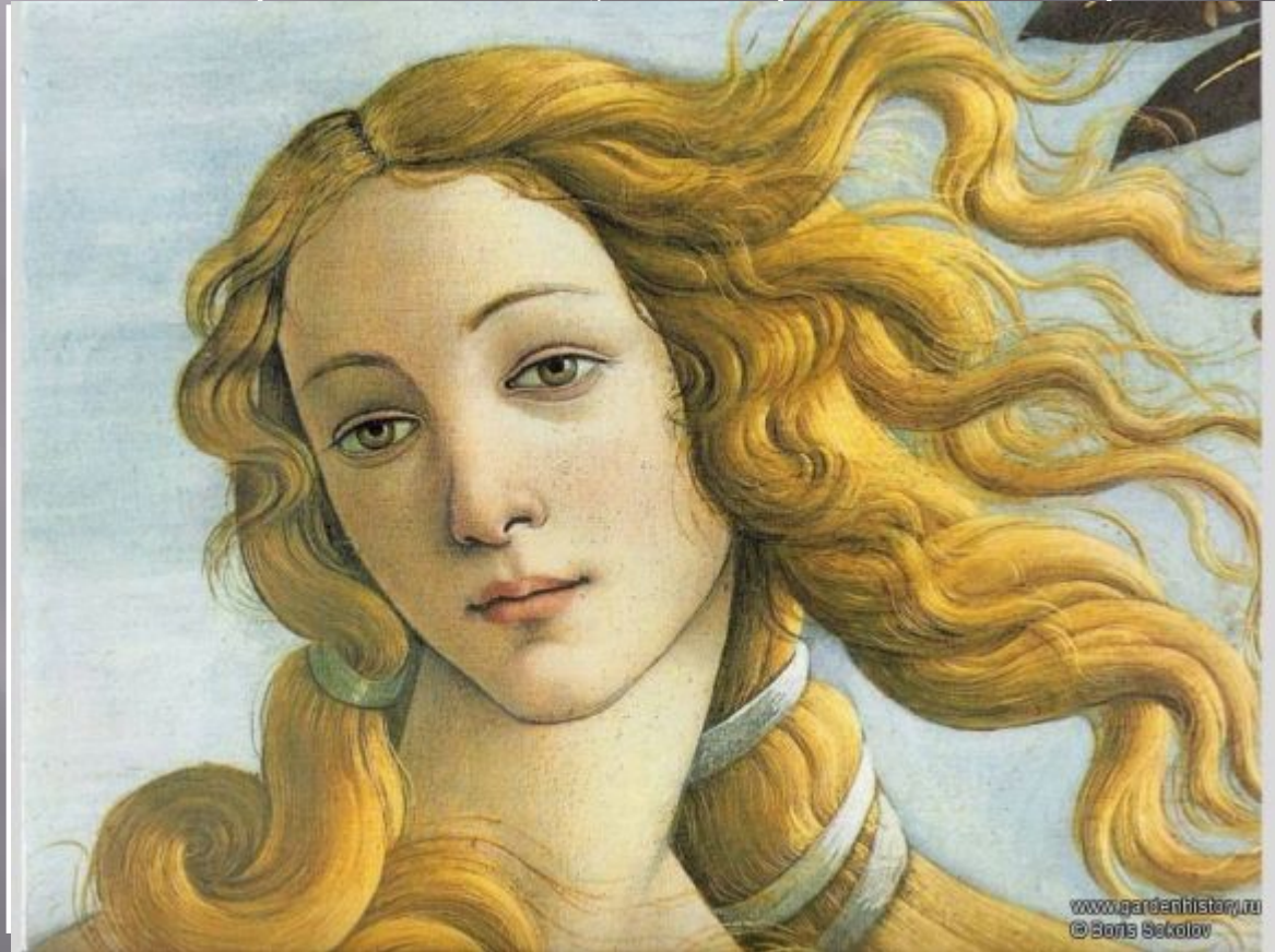
Сандро Боттичелли Рождение Венеры

Творчество этого великого итальянского художника по праву считается вершиной искусства раннего Возрождения.