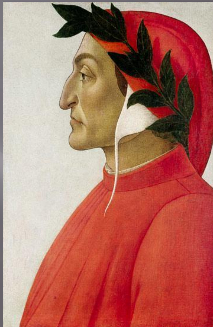
Сандро Боттичелли Портрет Данте Алигьери

Великий итальянский поэт, автор «Божественной комедии», в которой описываются странствия самого поэта по загробному миру.