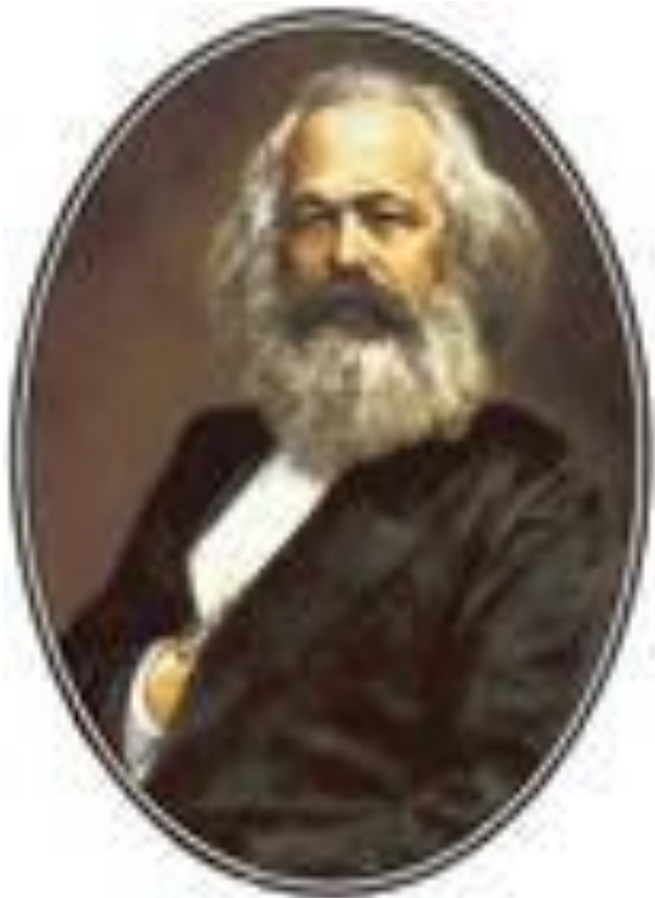
Карл Маркс (1818-1883)