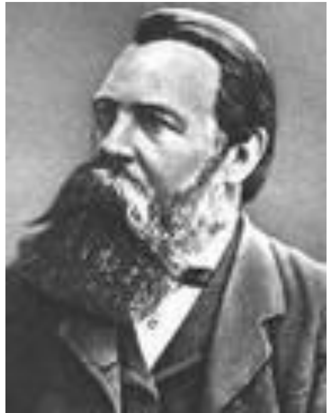
Фридрих Энгельс (1820-1895)