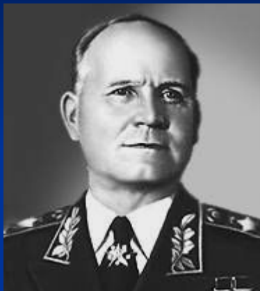
И. С. Конев