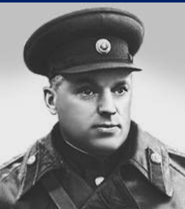
К. К. Рокоссовский