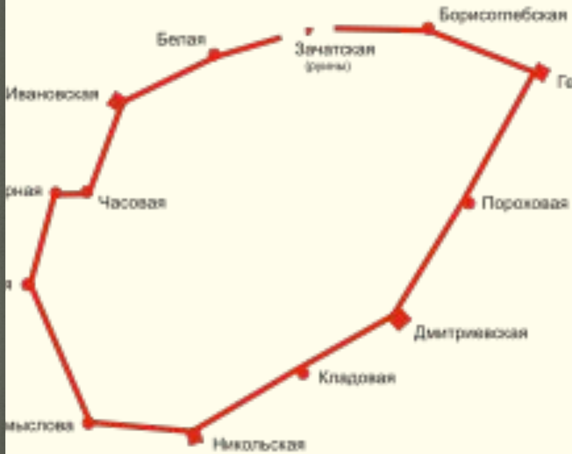
План нижегородского кремля