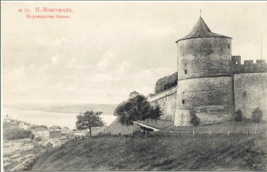
№ 13. Н.-Новгородъ. Коромыслова башня.

В итоге вражья сила от городских стен отступила .