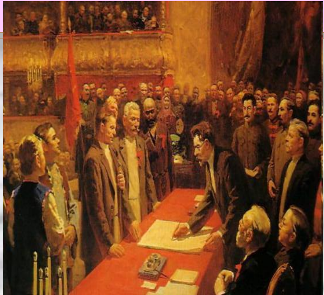
Подписание договора об образовании СССР

Москва. Юридическое Издательство Наркомюста. 1924.