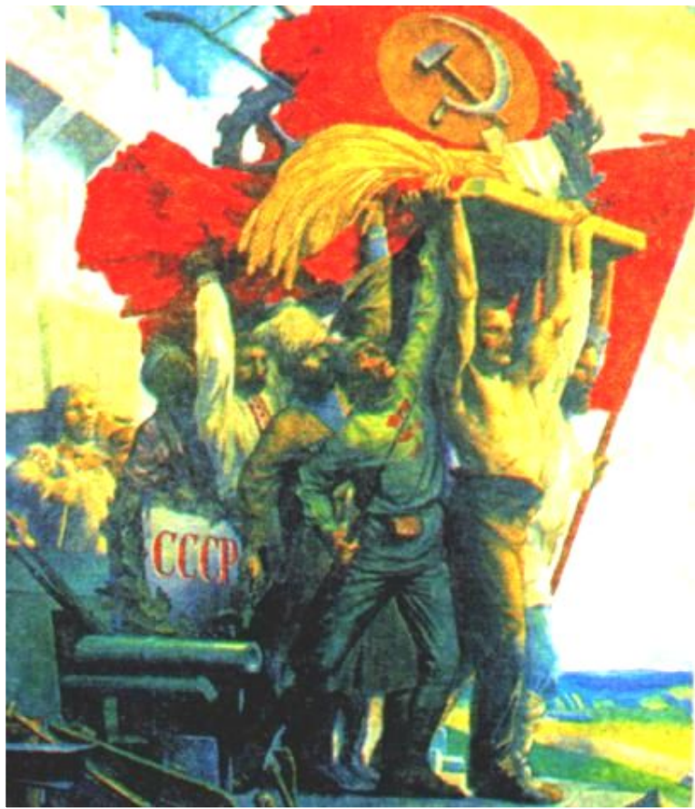
С.Карпов. Дружба народов.

Представители коренных народов привлекались к управлению государством, для них создавались льготы при приеме в ВУЗы. Но «коренизация» имела и отрицательные моменты. В Киргизии началось насильственное переселение русских с их земель. На Украине украинский язык стал государственным и без его знания нельзя было занимать никакие должности.