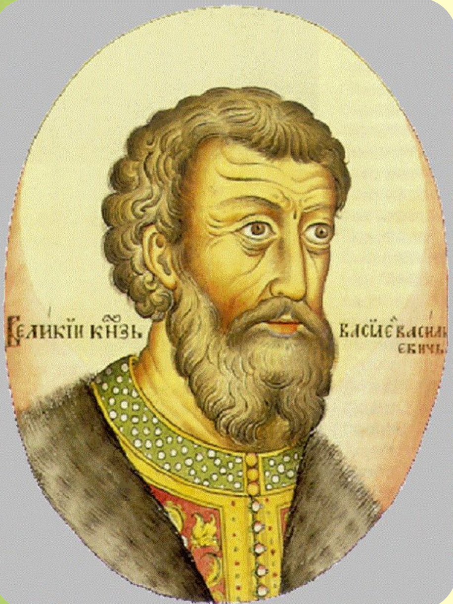
Василий I (1389-1425)