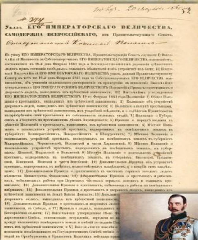
Указ императора Александра II о даровании крепостным людям прав состояния свободных сельских обывателей и об устройстве их быта. 2 марта 1861 г.