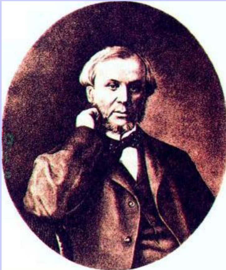
Николай Алексеевич Милютин