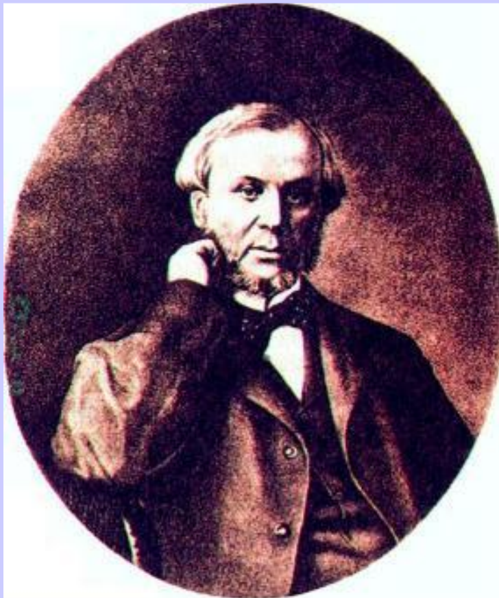
Николай Алексеевич Милютин