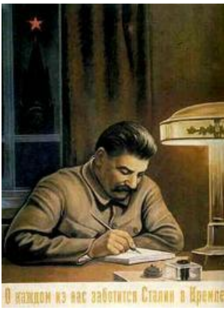
Плакат 1932 г.

Характерной чертой политической жизни этого периода стал культ личности И. Сталина. 21 декабря 1929 г., в день 50-летия Сталина, страна узнала, что у нее есть великий вождь. Он был объявлен «первым учеником Ленина». Вскоре Сталину стали приписывать все успехи страны. Он именовался «великим», «мудрым», «вождем мирового пролетариата», «великим стратегом пятилетки».