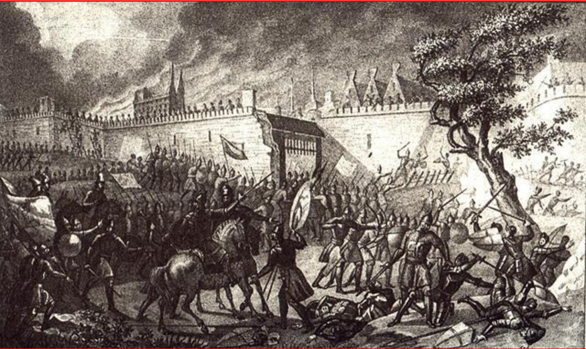
Русские войска штурмуют Нарву