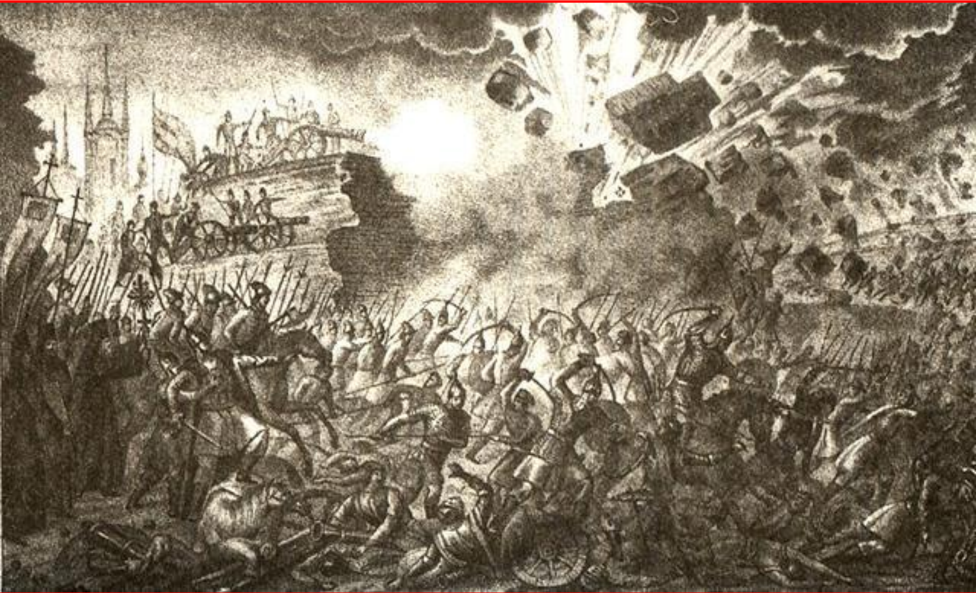
Осада Пскова войсками Стефана Батория