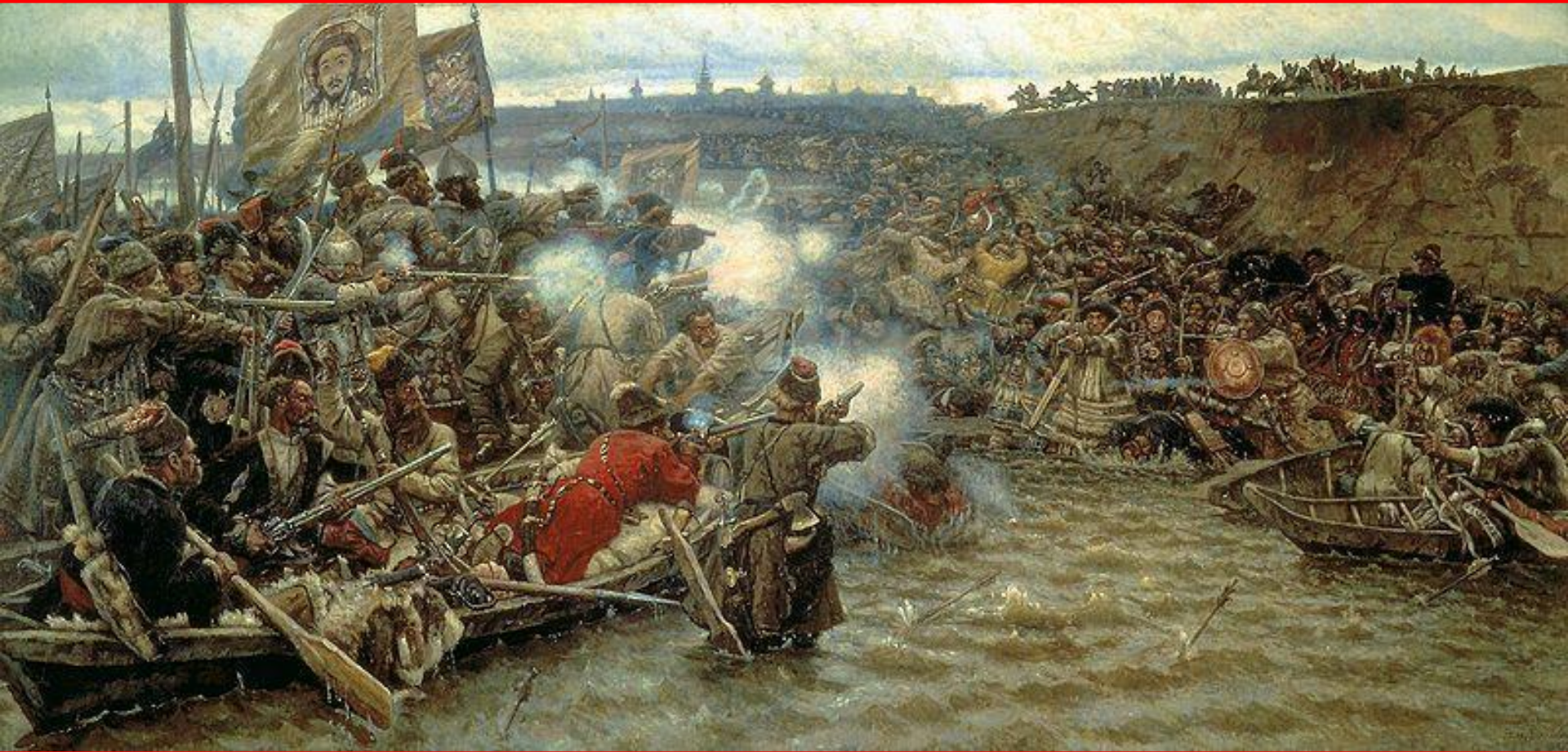
Покорение Сибири Ермаком. Суриков В.И.