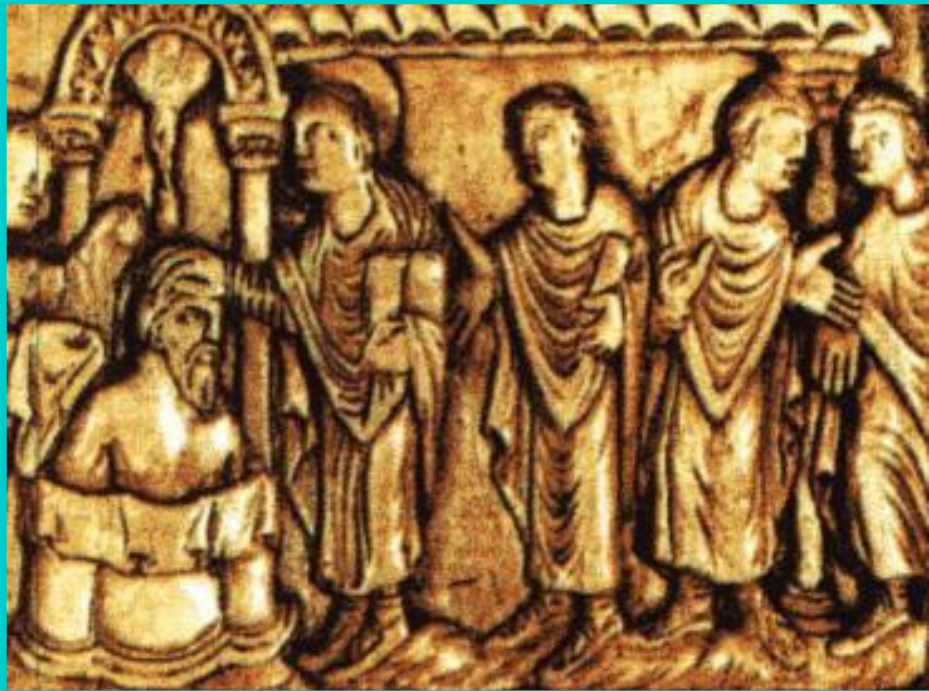
Крещение Хлодвига. Древний барельеф.

Хлодвиг был умным политиком, -он понимал, что одной силы мало для того, чтобы держать население в покорности.