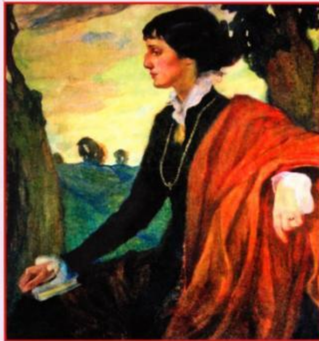
О.Л.Делла Вос-Кардовская. Портрет А.А.Ахматовой. Царское Село. 1915.

Ахматова выстояла, выстояла в значительной степени благодаря своим стихам, «священному ремеслу», с которым «и без света миру светло», благодаря своей способности слышать музыку природы и тишину земли, благодаря способности сочувствовать всем страдающим людям. Ахматова, сознавая естественность и неизбежность несчастья, преодолевает это несчастье и достойно противостоит превосходящим силам судьбы.