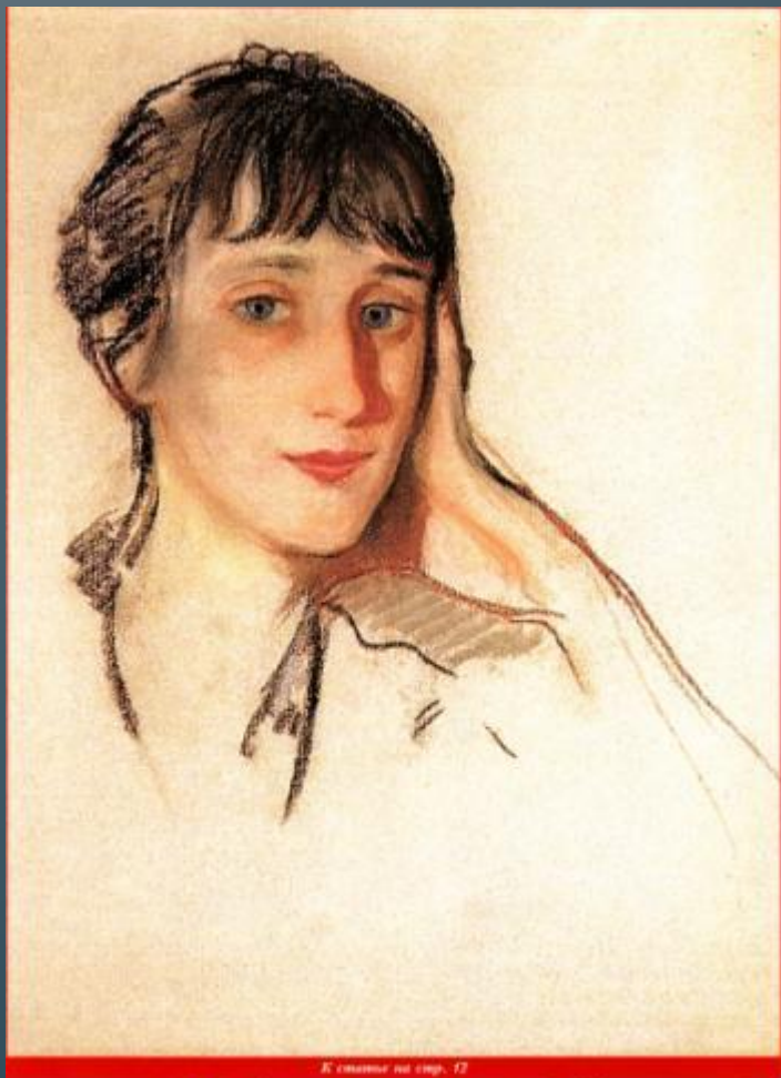
З.Е.Серебрякова. Портрет А.Ахматовой. 1922