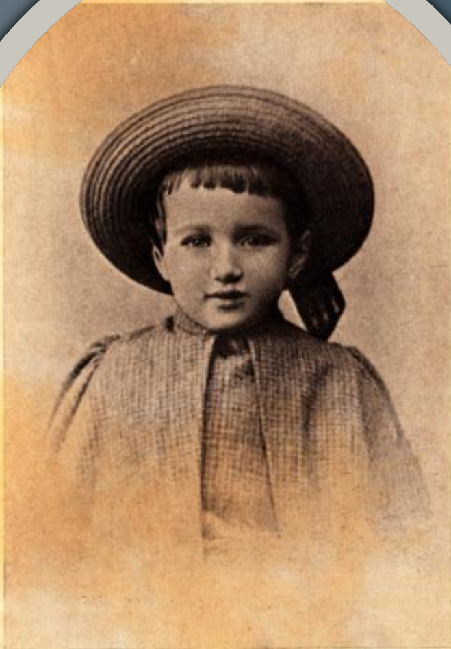
А. А. Ахматова в детстве. 1894

1890 -1905. Детские годы прошли в Царском Селе. Училась в женской Царскосельской гимназии.