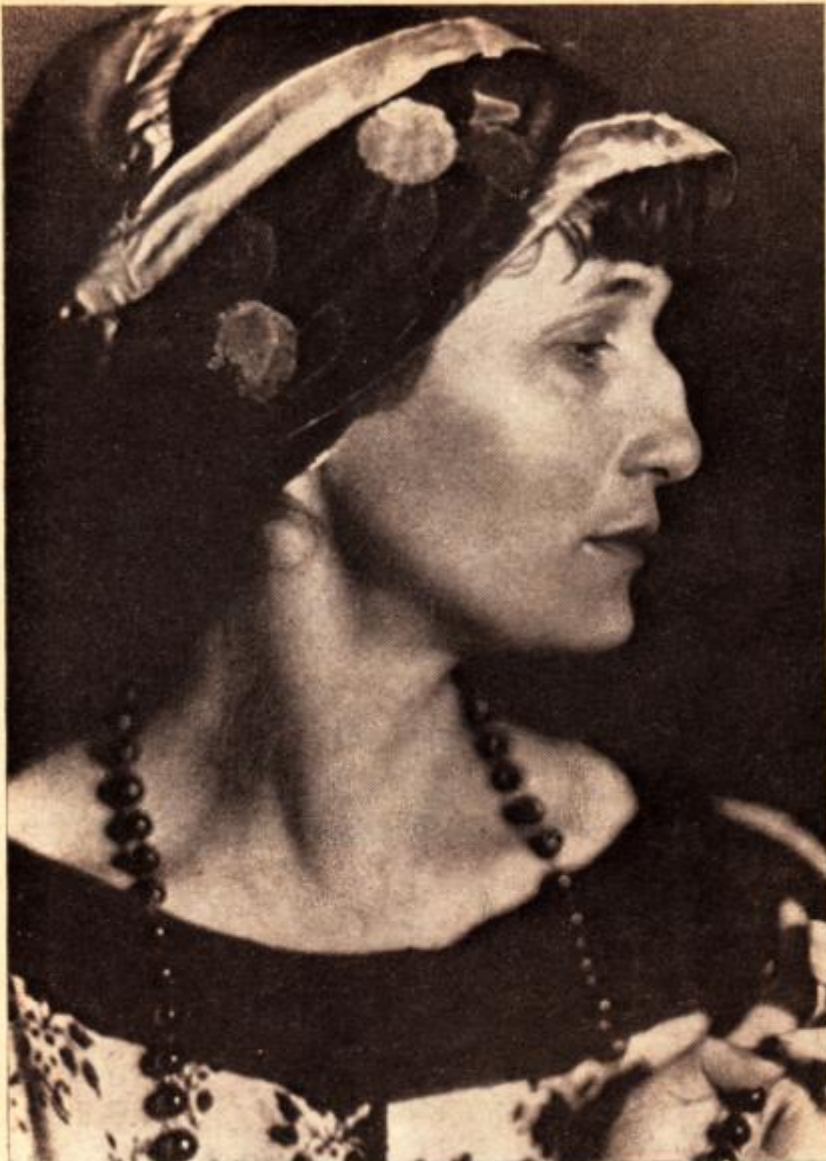
А. А. Ахматова. 1925