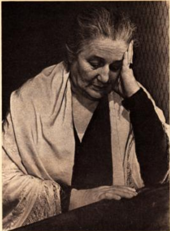
А. А. Ахматова. 1960

В этой жизни я немного видела, Только пела и ждала.