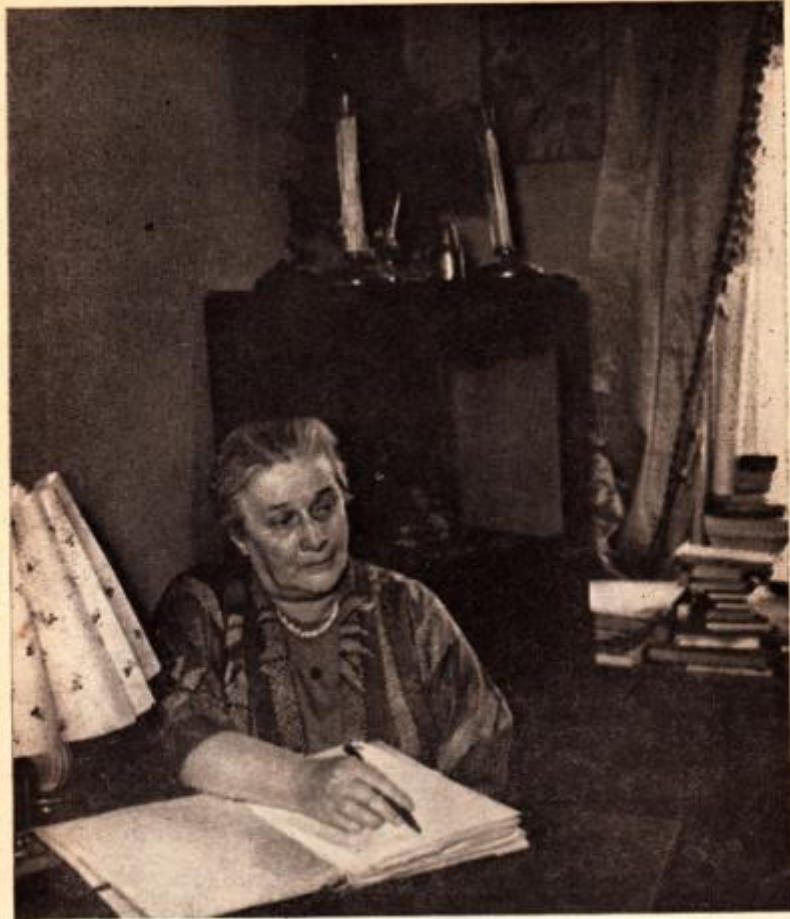
А. А. Ахматова. 1956