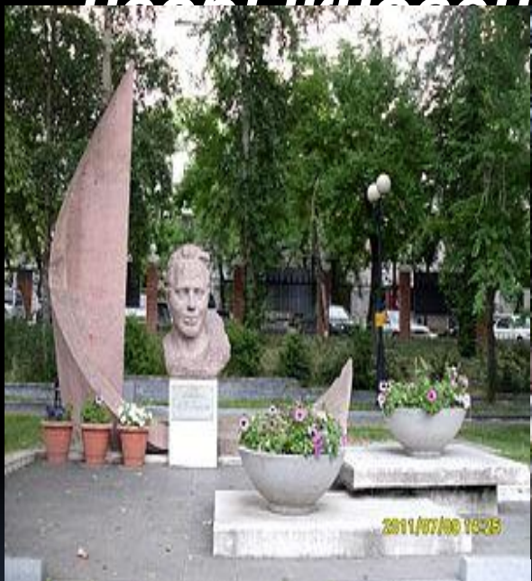
Мемориал памяти Аркадия Гайдара в Детском городском парке отдыха в г. Хабаровске. Автор — Галина Мазуренко

«Он умер изрешечённый фашистскими пулями, умер, защищая свою родную милую страну. Он жил замечательным писателем и любил свою родину и умер