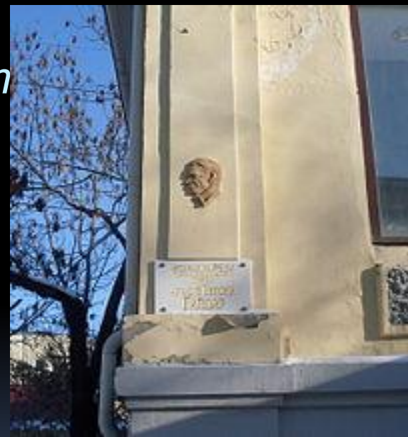
Мемориальная доска Аркадия Гайдара.