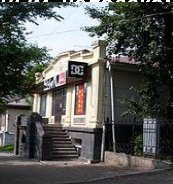
Здание в Хабаровске, в нём размещалась редакция газеты «Тихоокеанская звезда». В 1956 году на нём была закреплена мемориальная доска памяти Аркадия Гайдара