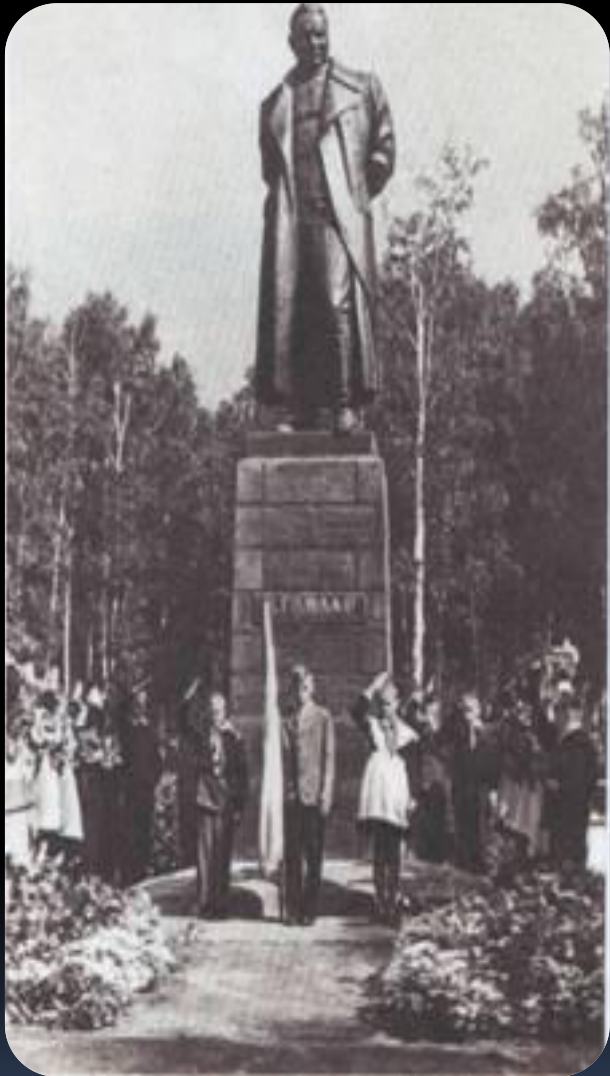
Памятник А. П. Гайдару в Арзамасе

Псевдонимом «Гайдар» писатель и журналист Аркадий Голиков начал подписывать свои произведения с 1925 года. Биографы строили различные предположения. «Гайдар» по-монгольски значит «всадник, скачущий впереди». Так звучит одна из версий. Гайдар служил в Хакассии в 1922 году. Он был начальником второго боевого района по борьбе с бандитизмом. Местные жители, увидев его, спрашивали друг друга: «Хайдар Голиков?». что