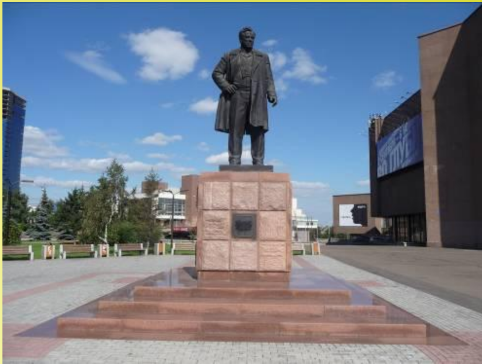
Памятник В. П. Астафьеву в Красноярске (2006). Скульптор Игорь Линеви- ч-Яворский