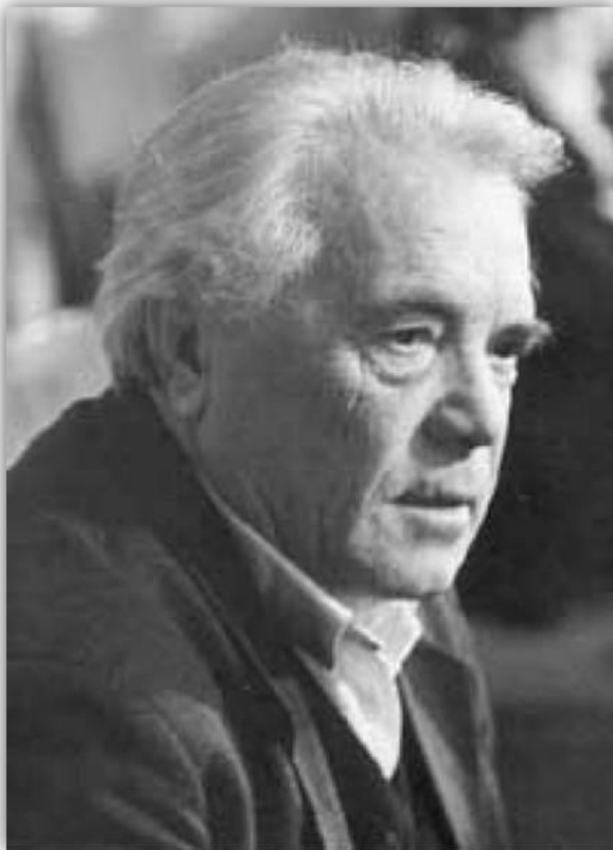
Виктор Петрович Астафьев 1924 - 2004