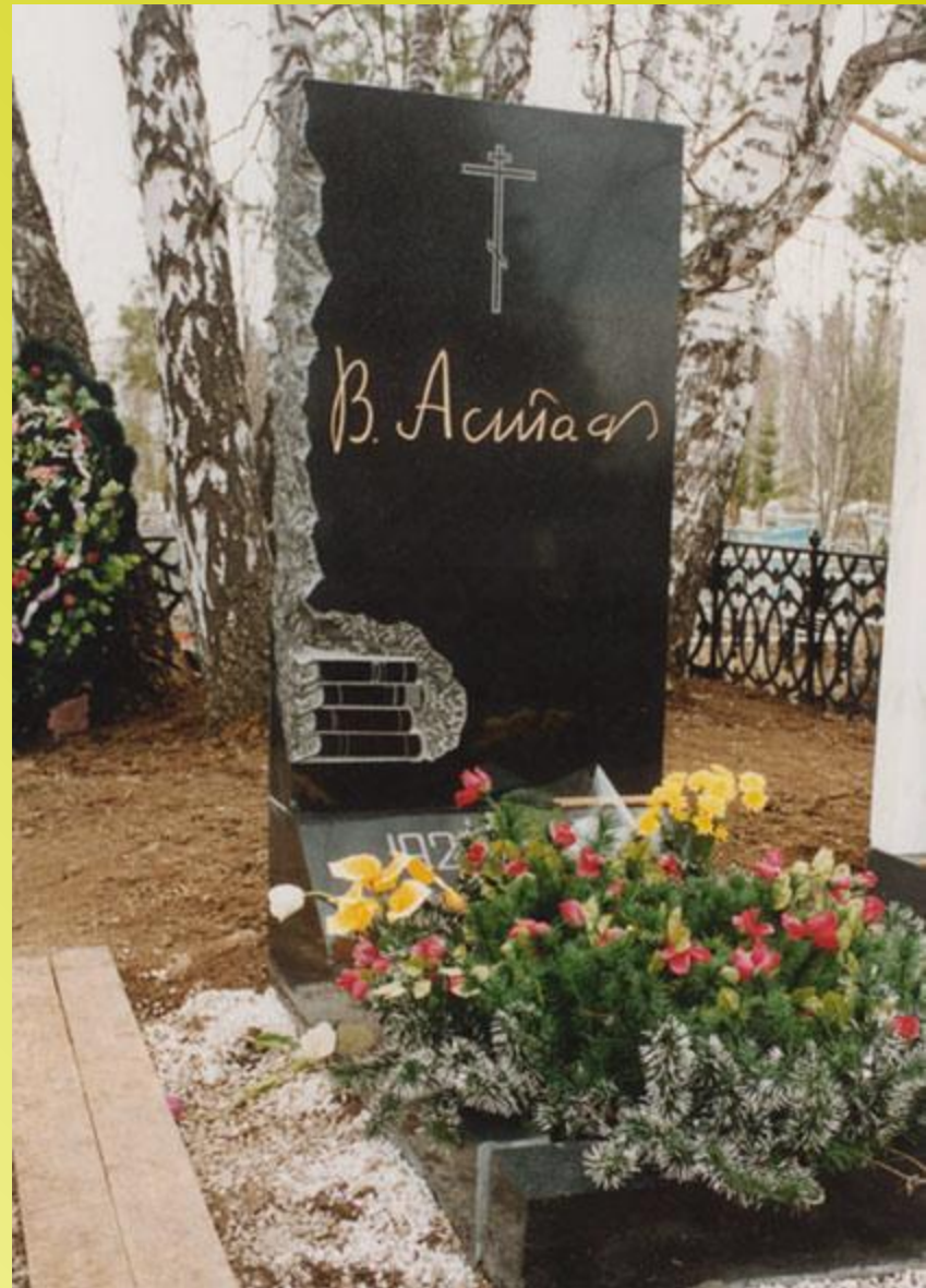
Могила писателя в родном селе