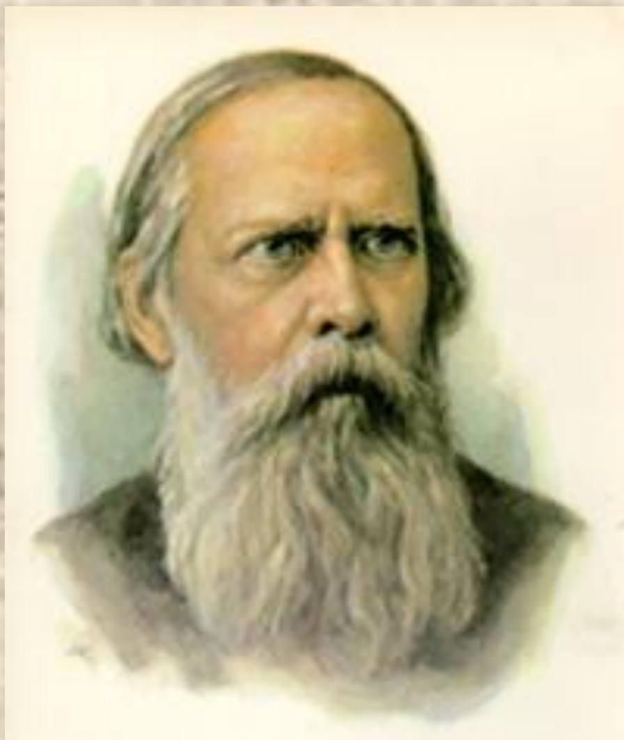
Салтыков-Щедрин (псевдоним - Н. Щедрин) Михаил Евграфович (1826 - 1889), прозаик.