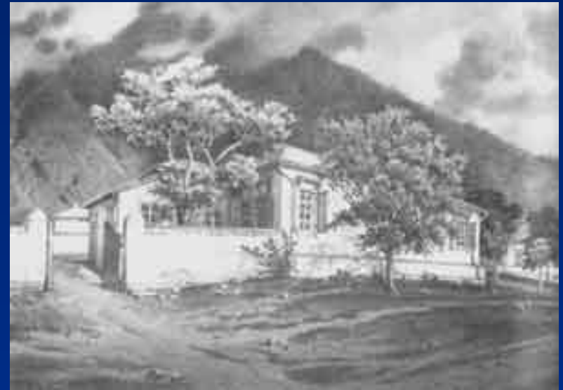
Дом Верзилиных в Пятигорске.

Кавказскому городу Пятигорску было суждено сыграть роковую роль в жизни поэта: здесь, кроме прочих старых знакомых, Лермонтов находит своего товарища по Школе юнкеров Мартынова. На одном из вечеров в пятигорском семействе Верзилиных шутки Лермонтова задели Мартынова. Ссора повлекла за собой вызов; не придавая значения размолвке, Лермонтов принял его, не намереваясь стрелять в товарища.