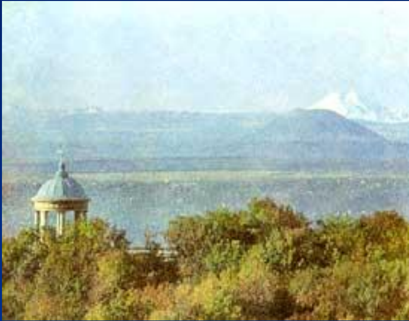
Беседка «Золова арфа»