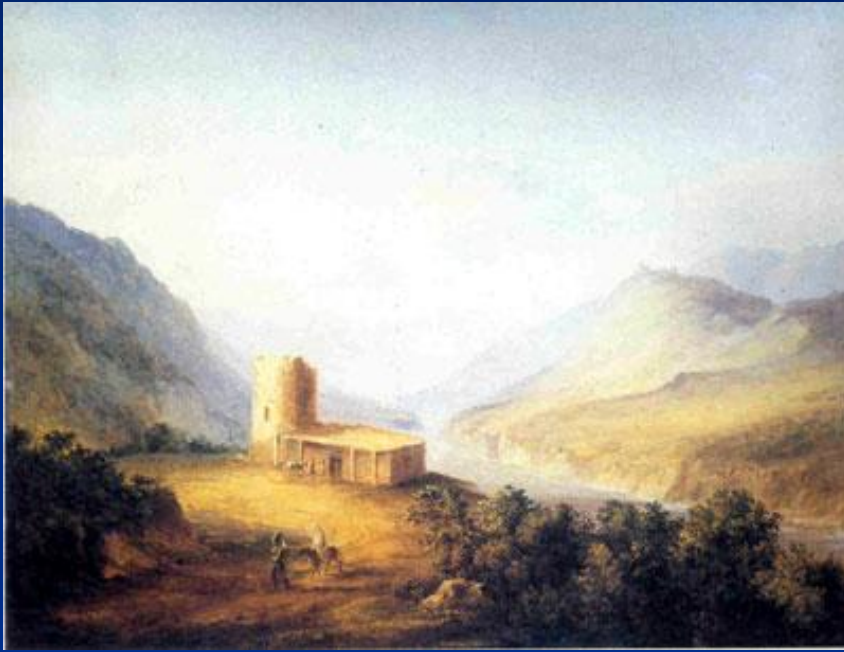
Военно-грузинская дорога близ Мцхета