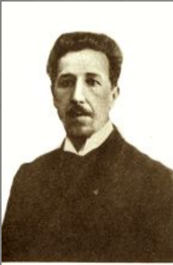
В.П. Лотарев (1860 – 1904)