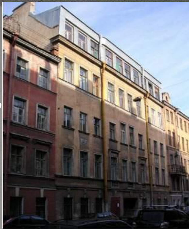
Средняя Подъяческая ул., 5. В 1910-х гг. в этом доме жил И.Северянин

В 1896 г. родители развелись, и будущий поэт уехал с отцом, вышедшим к тому времени в отставку, в Череповец. Закончил четыре класса Череповецкого реального училища. Стихи начал писать в 8 лет.