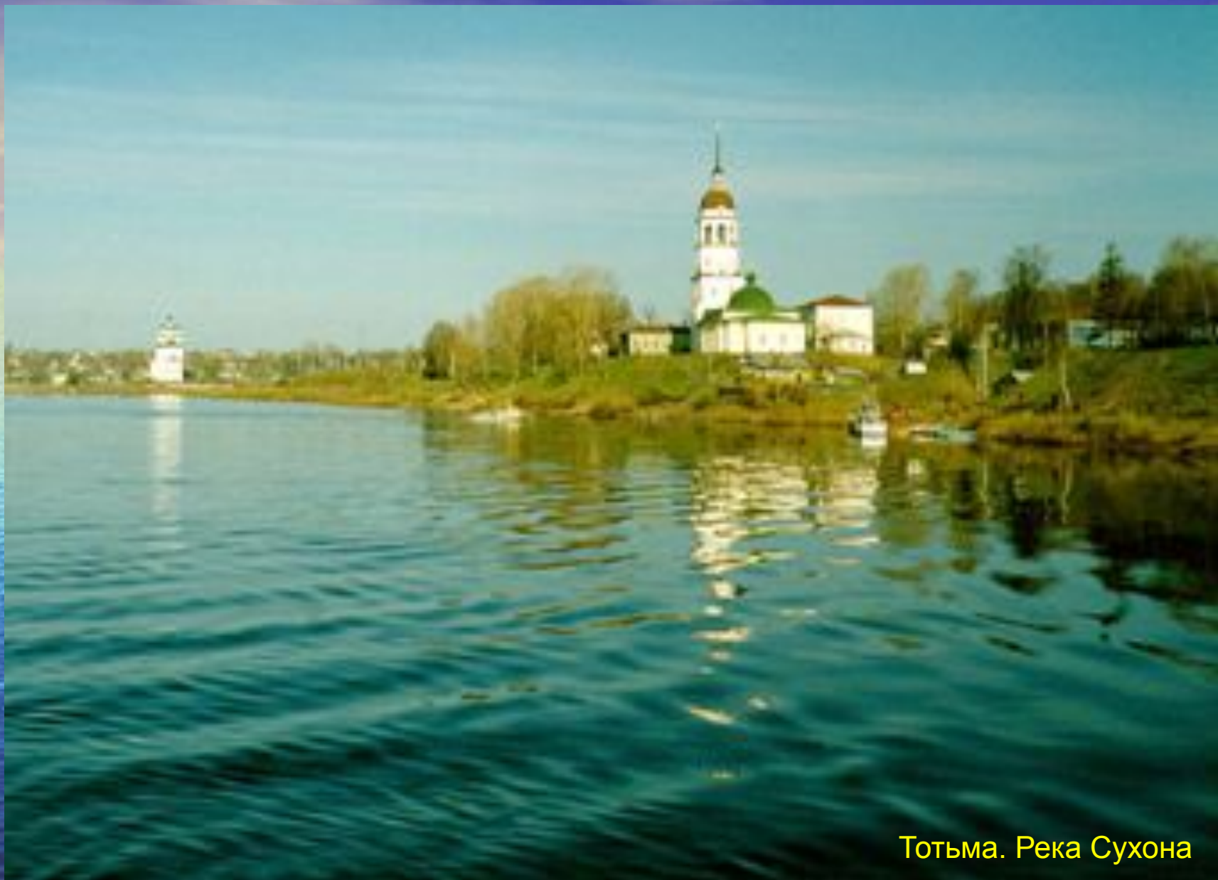
Тотьма. Река Сухона