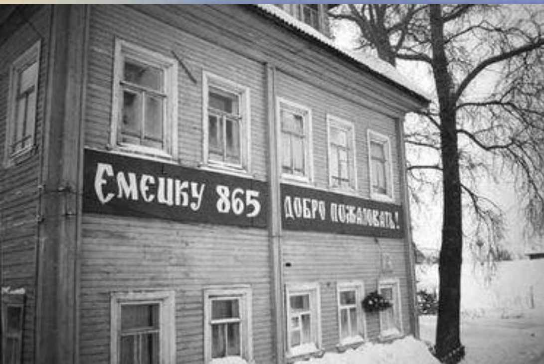
Дом в с. Емецк Архангельской области, где в 1936 г. родился Николай Рубцов