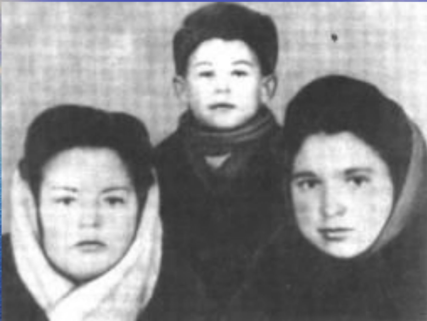
Николай Рубцов с воспитательницами детдома