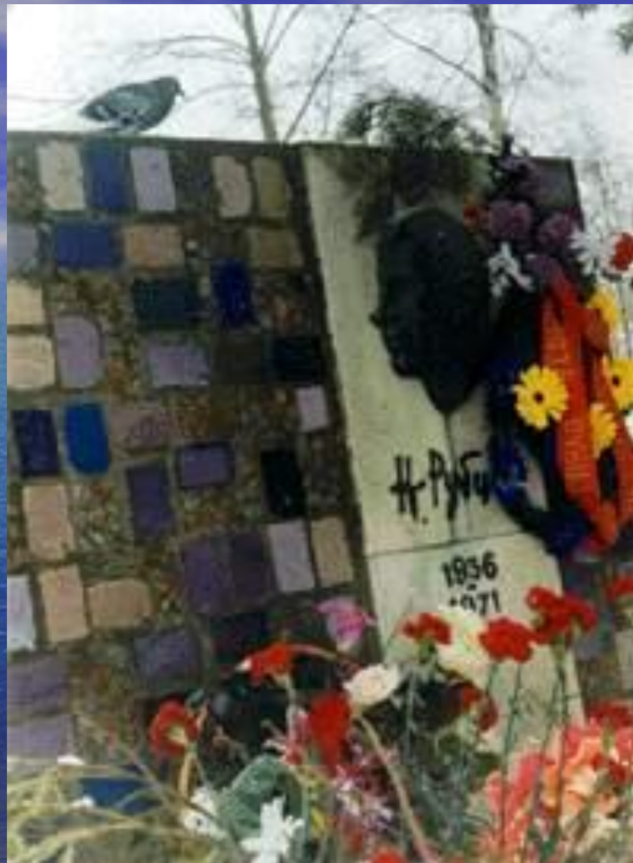
Могила Н. Рубцова