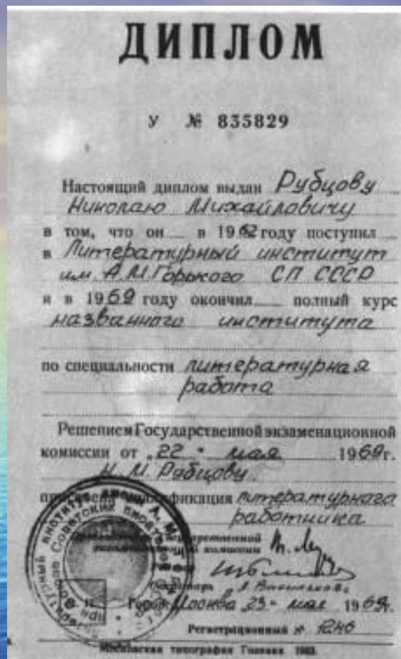
Диплом об окончании Литературного института