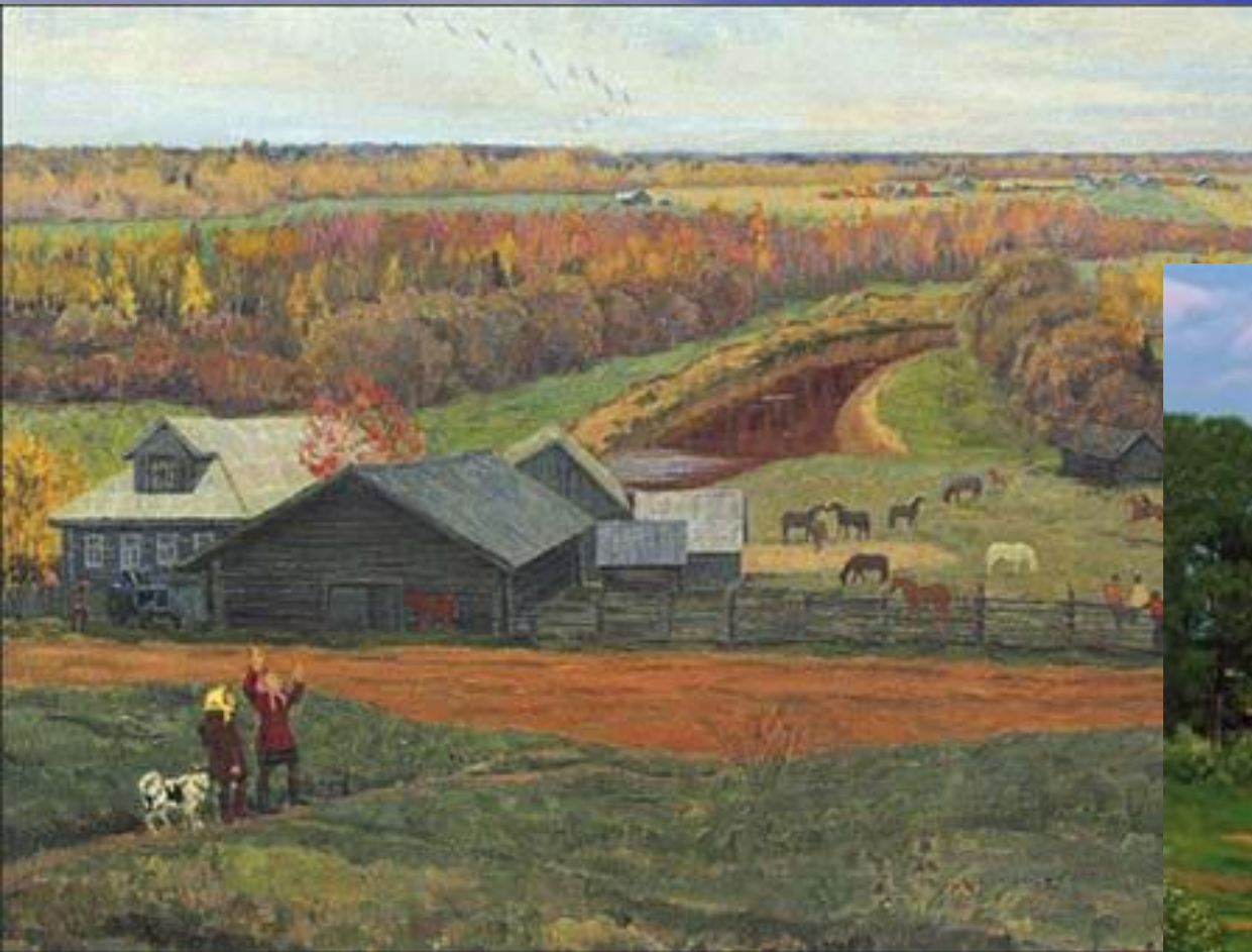
Журавли над Николою (Евгений Соколов)