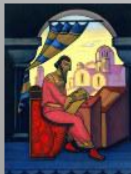
Ярослав Мудрый (Н. К. Рерих)