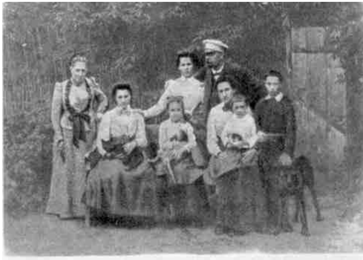
Семья Цветаевых во дворе дома в Трехпрудном. Стоят: Андрей, Иван Владимирович, Ольга Иловайская; сидят: Мария Александровна с дочерью Анастасией, Марина, Валерия.