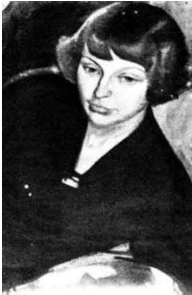
Марина Цветаева. 1913 год. Портрет работы Магды Нахман.