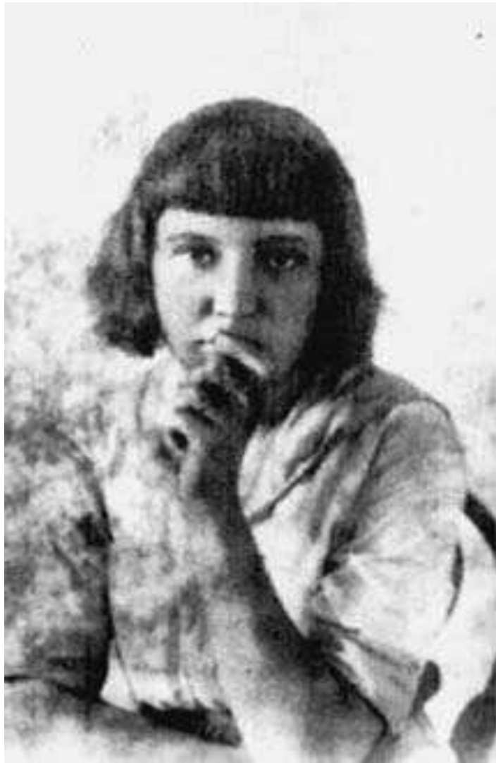
М.Цветаева 1913 г.