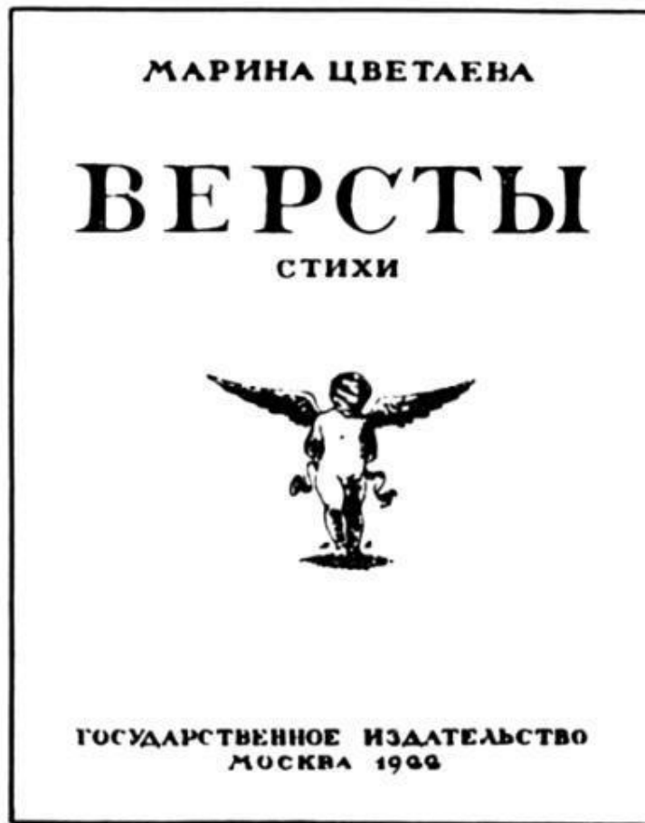
М. И. Цветаева. «Версты». Обложка работы Н. Н. Вышеславцева