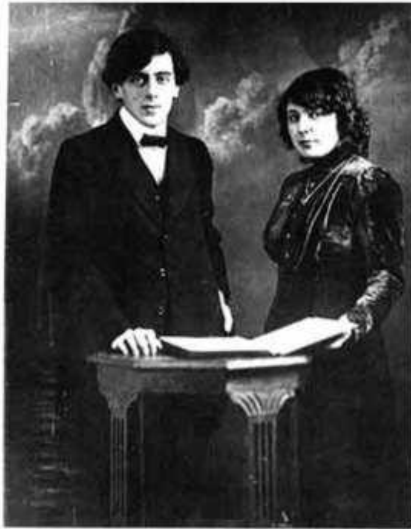
Сергей Эфрон и Марина Цветаева незадолго до свадьбы. 1911 год.