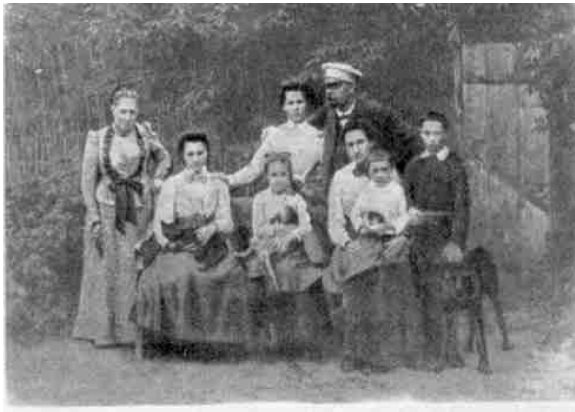
Семья Цветаевых во дворе дома в Трехпрудном. Стоят: Андрей, Иван Владимирович, Ольга Иловайская; сидят: Мария Александровна с дочерью Анастасией, Марина, Валерия.