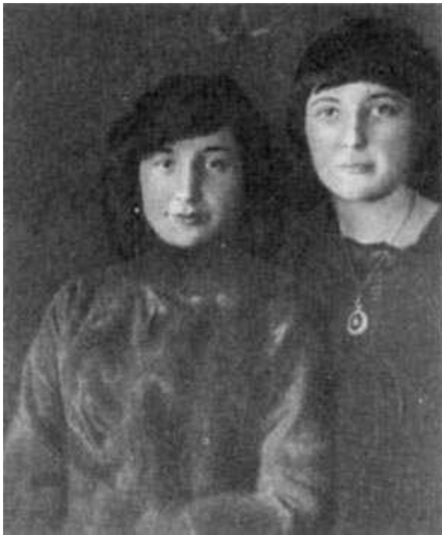
Анастасия и Марина Цветаевы