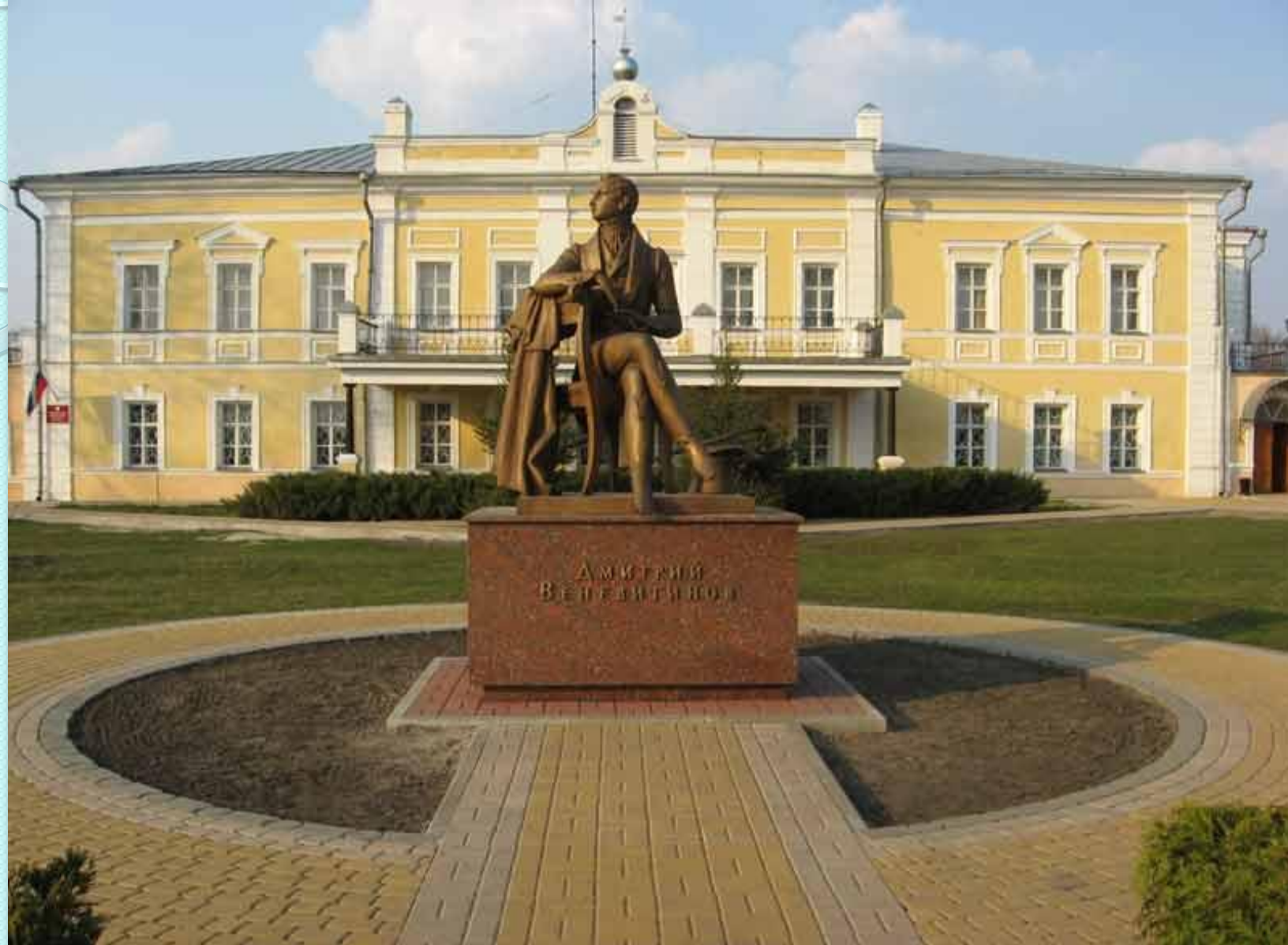
ПАМЯТНИК ВЕНЕВИТИНУ ДМИТРИЮ ВЛАДИМИРОВИЧУ