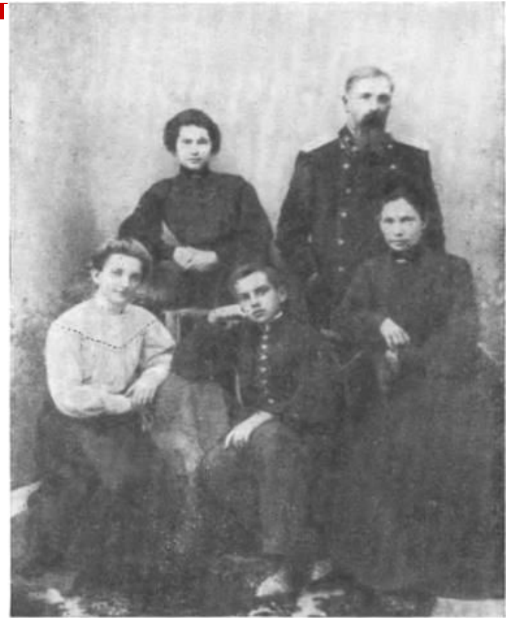
Семья Маяковских. Кутаиси, 1905.