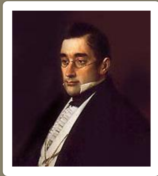
А. С. Грибоедов