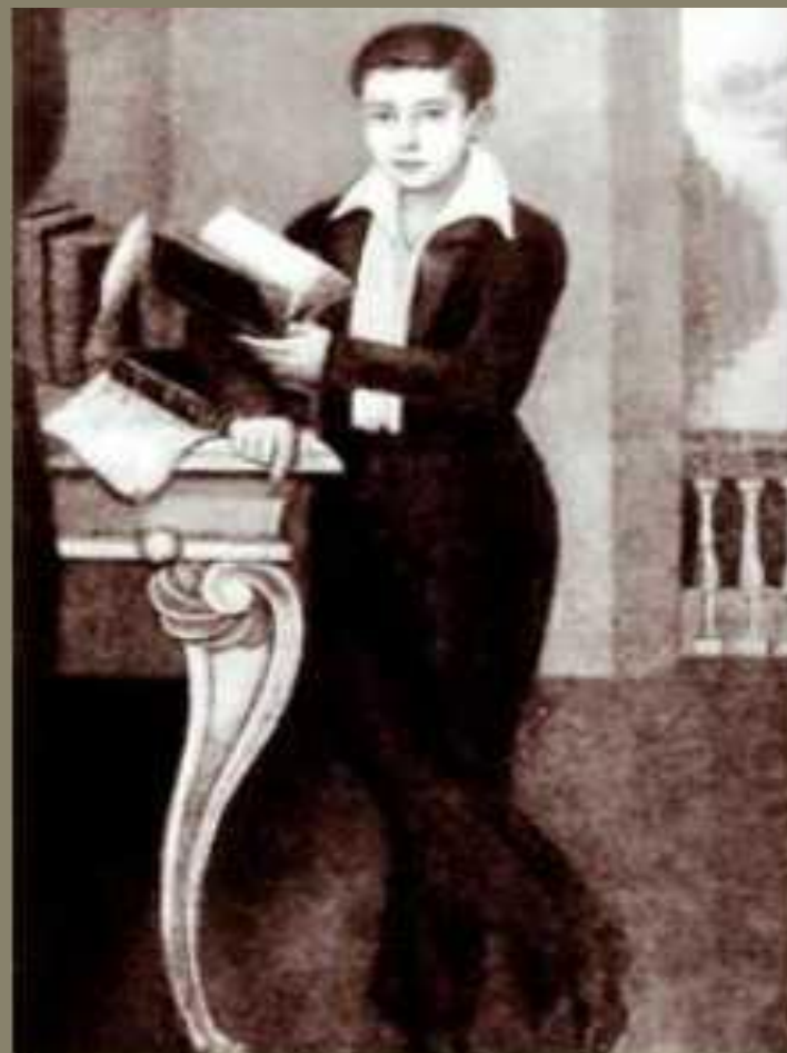
Юный А. С. Грибоедов в Хмелите