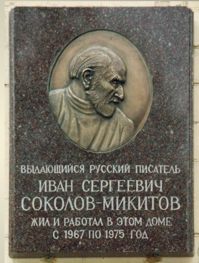
Мемориальная доска выдающемуся русскому писателю в Москве