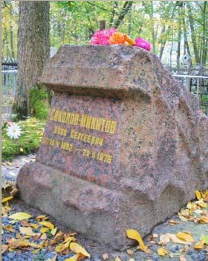
Памятник писателю на Гатчине.