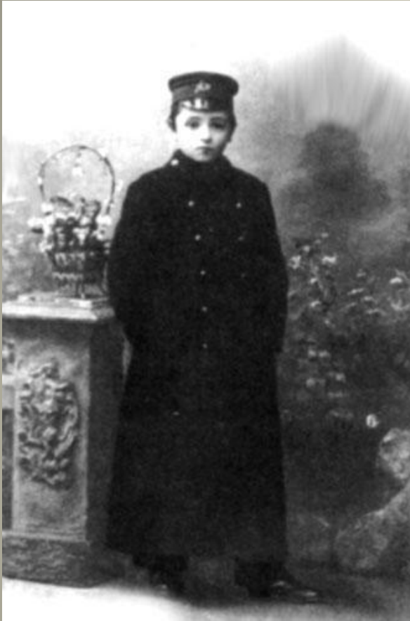
Ученик Александровского училища, 1910

Когда ему исполнилось десять лет отец отвез его в Смоленск где определил в Смоленское Александровское реальное училище. В училище Соколов-Микитов увлёкся идеями революции. За участие в подпольных революционных кружках Соколов-Микитов был исключён из пятого класса училища