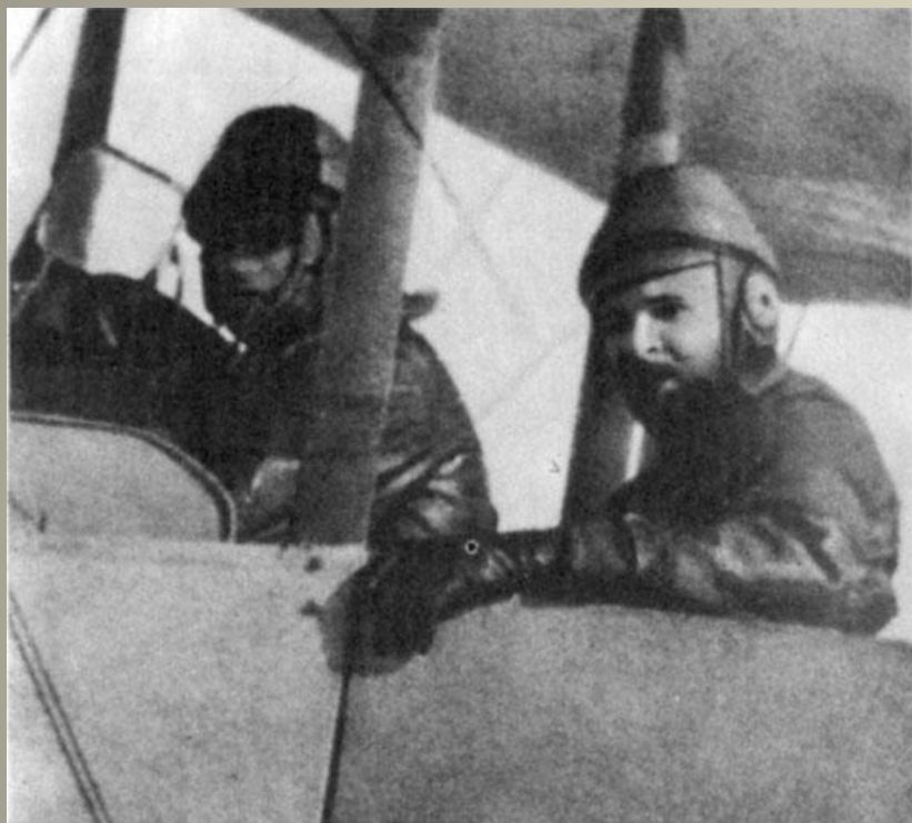
На бомбардировщике Илья Муромец

Семнадцати лет Иван Соколов-Микитов впервые ушел в море. Он служил на торговых судах, а в Первую мировую войну отправился добровольцем в санитарный отряд. Затем стал летчиком.