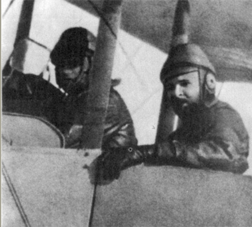
На бомбардировщике Илья Муромец

Семнадцати лет Иван Соколов-Микитов впервые ушел в море. Он служил на торговых судах, а в Первую мировую войну отправился добровольцем в санитарный отряд. Затем стал летчиком.