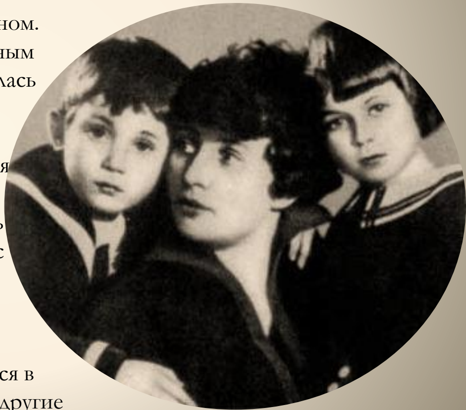
Зинаида Райх с детьми

Она тяжело пережила развод. Есенин находился в зените славы, рядом с ним то и дело мелькали другие женщины. А у Райх двое детей на руках, в доме нищета, душа полностью выжжена.