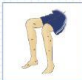
частые гнойничковые заболевания кожи