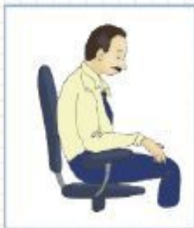
слабость, подавленное настроение