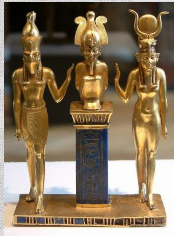
Гор, Осирис и Изида