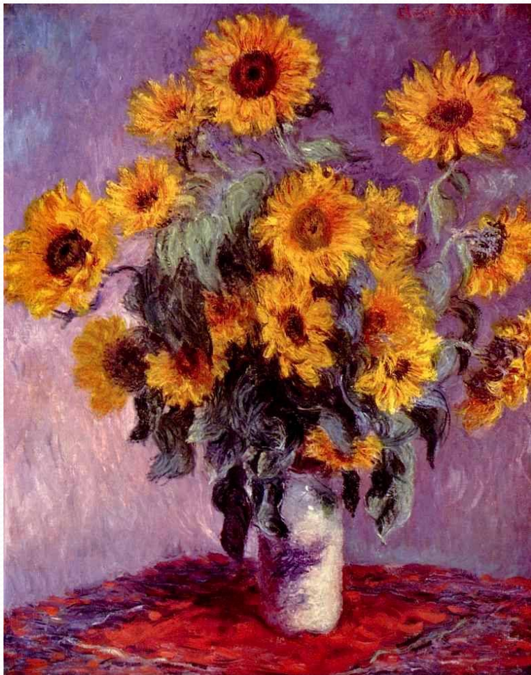
Подсолнухи. Год создания 1881