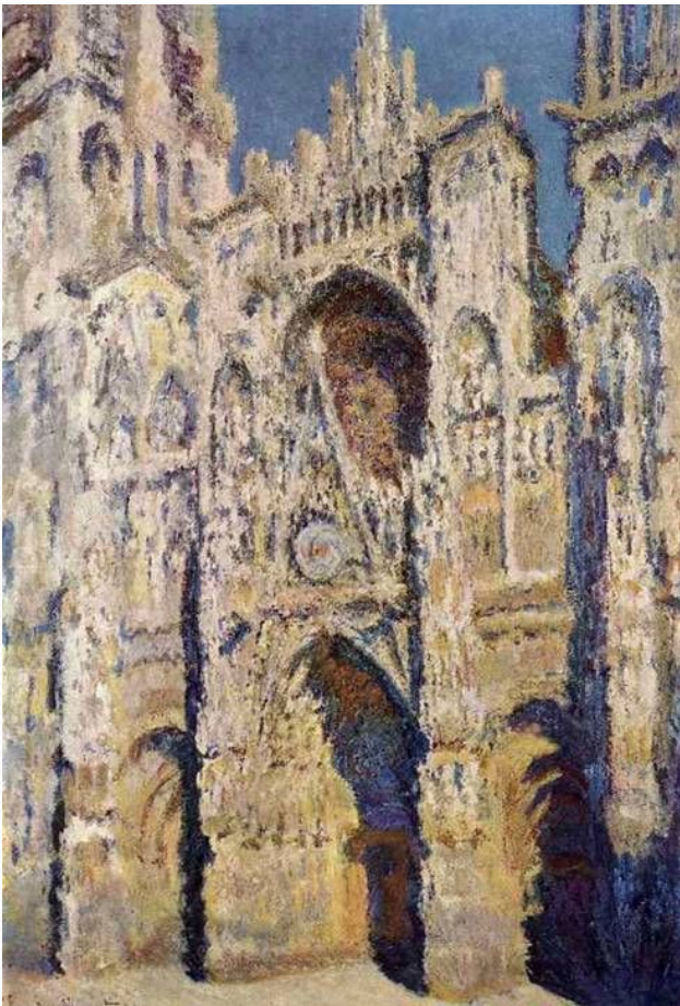
Собор в Руане. Год создания 1894