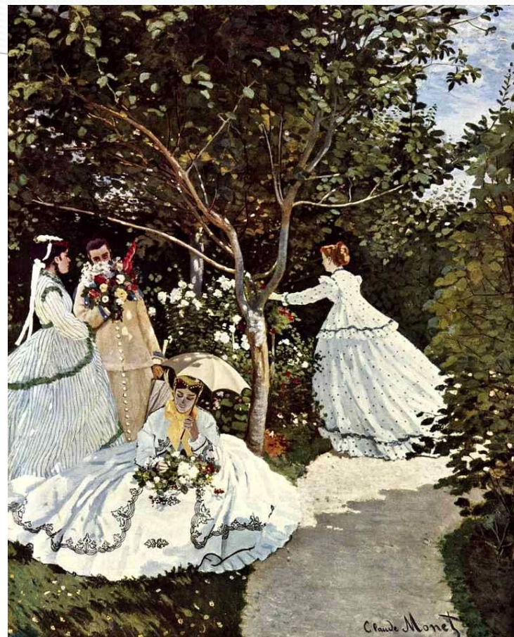
Женщины в саду Год создания 1867