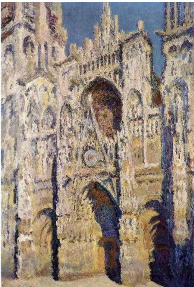
Собор в Руане. Год создания 1894