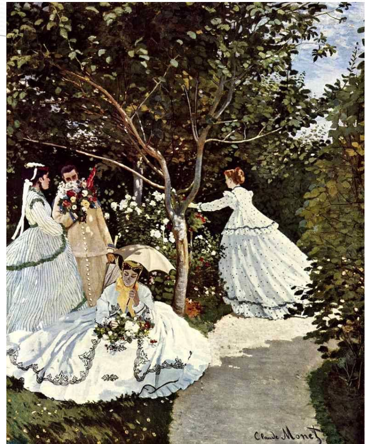
Женщины в саду Год создания 1867