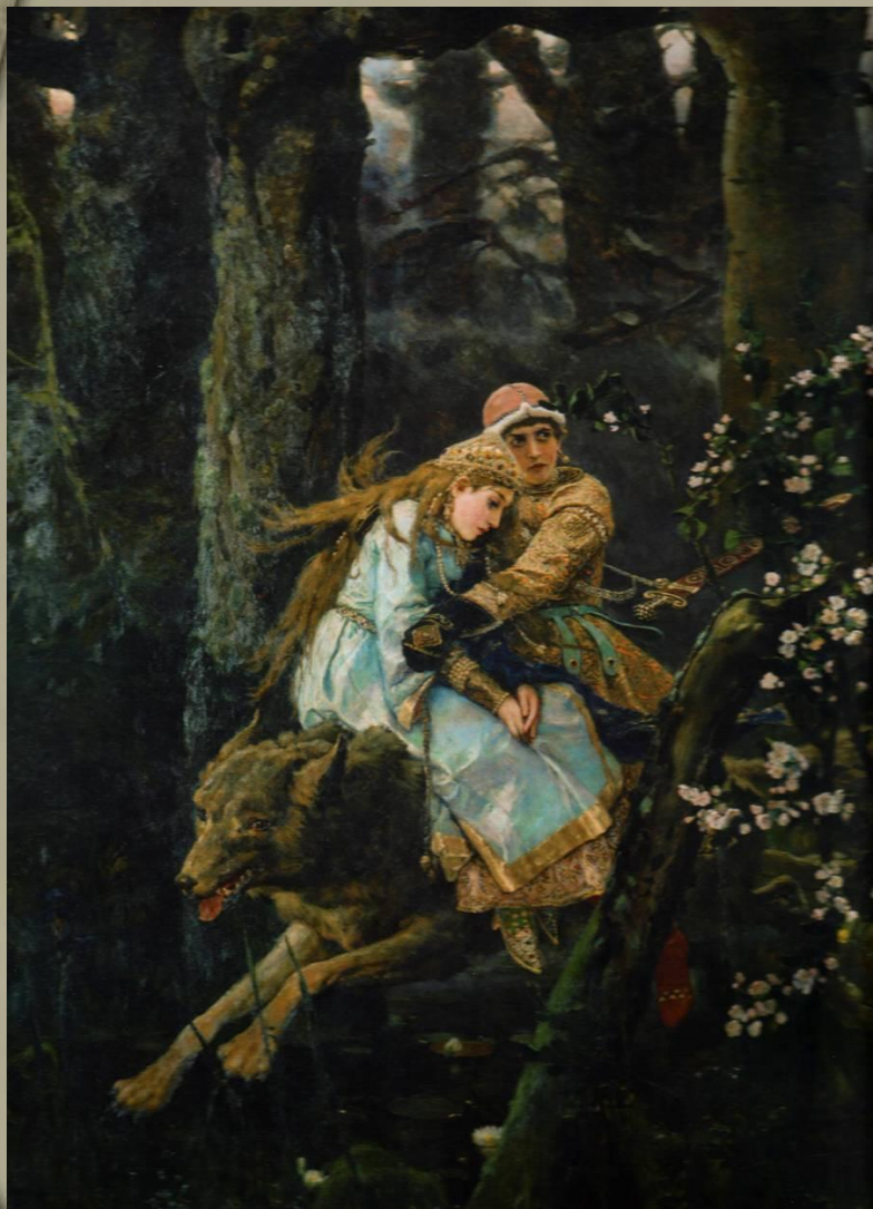
«Иван-царевич на сером волке» В.Васнецов