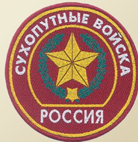
Нарукавный знак Сухопутных войск РФ