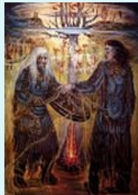
Обряд кормления огня