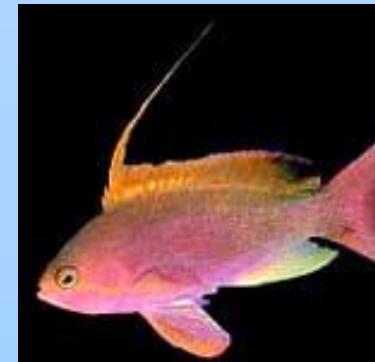
Рыба, обитающая на большой глубине