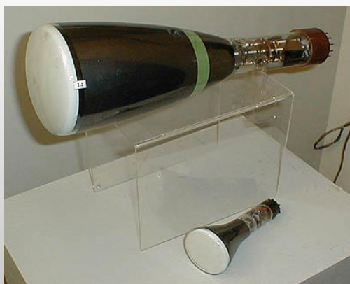
Электронно–лучевая трубка телевизоров

Это свечение твердых тел, вызванное бомбардировкой их электронами. Благодаря катодолюминесценции светятся экраны электронно – лучевых трубок телевизоров.