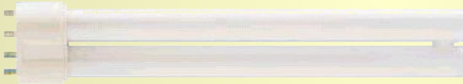
Лампа дневного света

Под действием падающего излучения, атомы вещества возбуждаются и после этого тела высвечиваются.