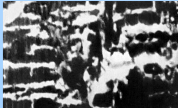
Кусок дерева, пронизанный светящейся грибницей