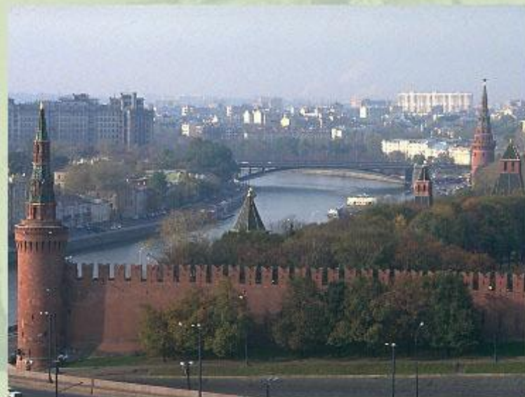
Кремль - сердце Москвы.

Подробнее узнать о истории строительства Великой Китайской стены и Московского Кремля, об их архитектуре и современном состоянии вы сможете, прочитав статьи в Энциклопедии.