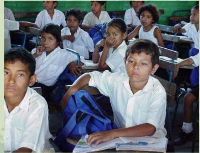
Занятие в школе в развивающейся стране.

Среди взрослого населения мира каждый третий не умеет читать и писать. Около половины неграмотных мира приходится на Китай и Индию, вторая половина - на развивающиеся страны Азии, Африки и Латинской Америки. В США, Японии, развитых странах Европы более 50% выпускников школ продолжают учебу в университетах, в Индии - лишь 10%. Возглавляют список самых неграмотных стран Сьерра-Леоне, Нигер, Мали, Эфиопия и Афганистан.