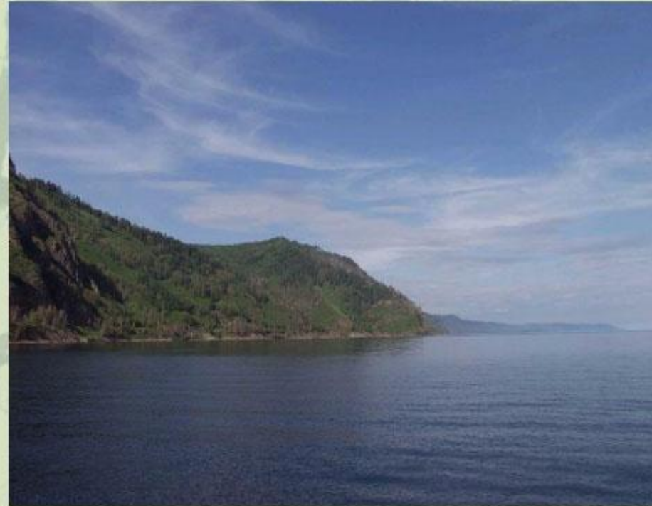
Байкал - глубочайшее озеро на Земле.

В ноябре 1972 года XX века ЮНЕСКО , обеспокоенная судьбой уникальных объектов природы и культуры, включила их в список Всемирного наследия - ведь они составляют достояние всего человечества! Памятники природы, вошедшие в список Всемирного наследия, составляют менее 20% от общего их количества. Особенно много их в Северной Америке, Австралии и Новой Зеландии. В числе известных природных объектов - г. Джомолунгма , Большой Каньон Колорадо , Большой Барьерный риф , оз. Байкал .