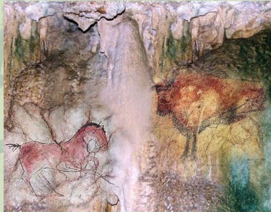
Наскальный рисунок древних людей.

Росписи на камнях и стенах пещер, пирамиды Древнего Египта, каменная обсерватория Стоунхендж, греческий Акрополь, Великая китайская стена, Московский Кремль и дворцы Санкт-Петербурга, статуя Свободы, столица Бразилии, театр в Сиднее - таковы важнейшие вехи в культурном развитии человечества, признанные шедеврами человеческой культуры. Ежегодно ученые многих стран мира открывают новые шедевры, которых уже сегодня насчитывается более 500.