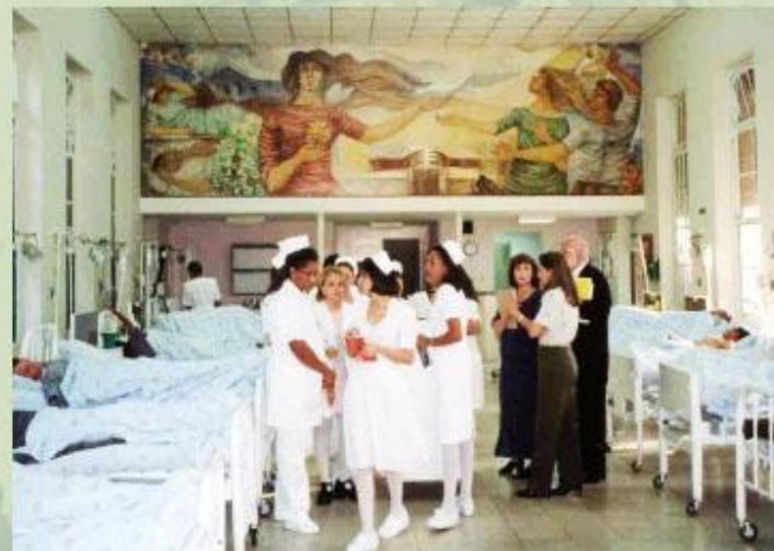
Современная больница в одной из развивающихся стран.

Увеличение продолжительности жизни населения, улучшение качества питания, снижение уровня заболеваемости - характерная черта многих стран современного мира. Однако в ряде бедных стран Африки и Азии все еще распространены туберкулез и малярия, тысячи детей ежегодно умирают от столбняка. Массовой проблемой для всех стран мира является распространение СПИДа.