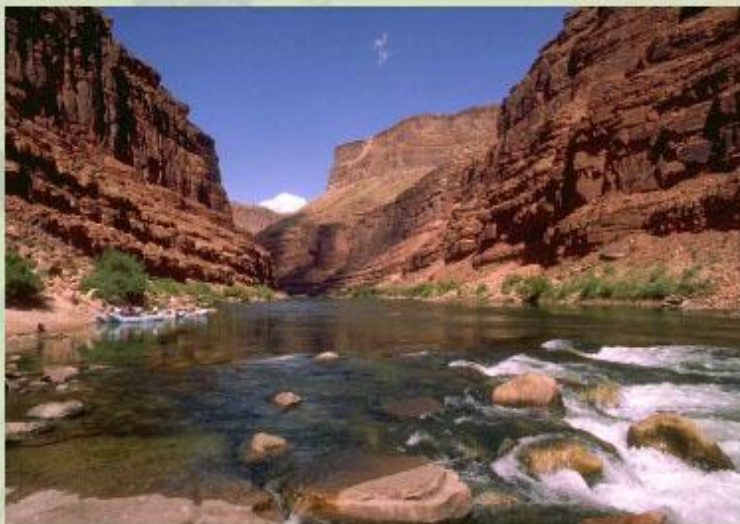
Большой Каньон Колорадо.