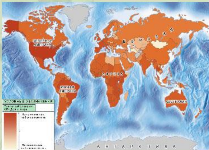
Карта распространения СПИДа в мире.