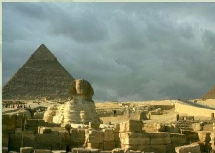
Пирамиды Древнего Египта.