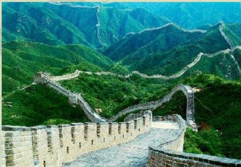
Великая Китайская стена.