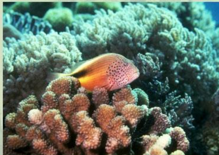
Большой Барьерный риф.

Узнать историю возникновения самого глубокого на суше Большого Каньона Колорадо вы сможете, прочитав статью Большой Каньон Колорадо .