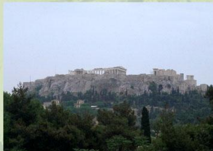
Афинский Акрополь - шедевр античной архитектуры.

Узнать об одном из древних «семи чудес света» - египетских пирамидах - вы сможете из статьи Египетские пирамиды .