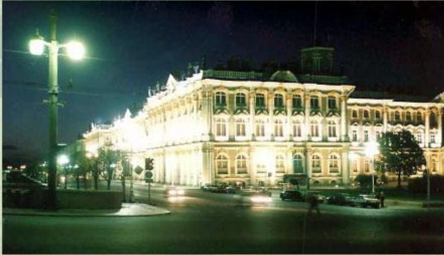
Эрмитаж - один из величайших музеев мира.