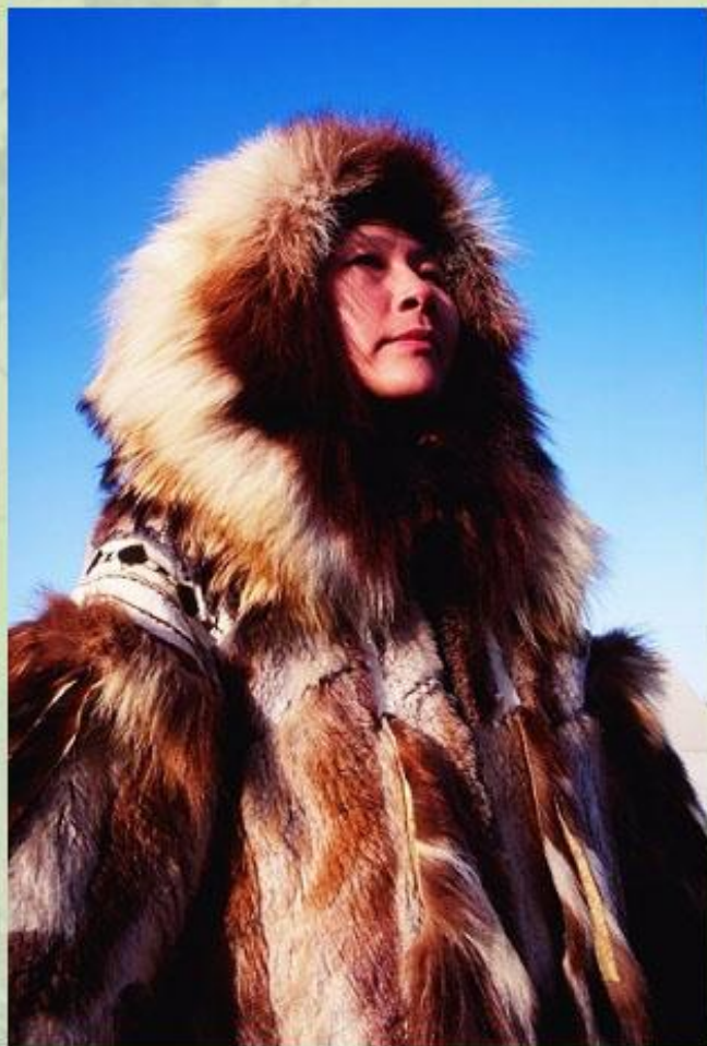
Малые народы Севера.

Не менее трагична судьба народов Севера в России, США и Канаде. В результате нефте- и газодобычи происходит сокращение площади естественных охотничьих угодий и оленьих пастбищ. Проникновение «чужих» людей на территории малых народов ведет к распространению эпидемий (например, гриппа), которые губительны для коренных жителей Севера.