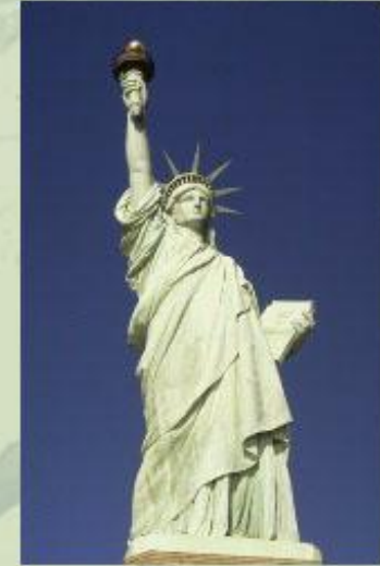
Статуя Свободы - символ США.

Эрмитаж в Санкт-Петербурге - бывший императорский дворец, а сейчас - один из крупнейших и известнейших музеев мира. Подробнее о нем вы сможете узнать в статье Эрмитаж .