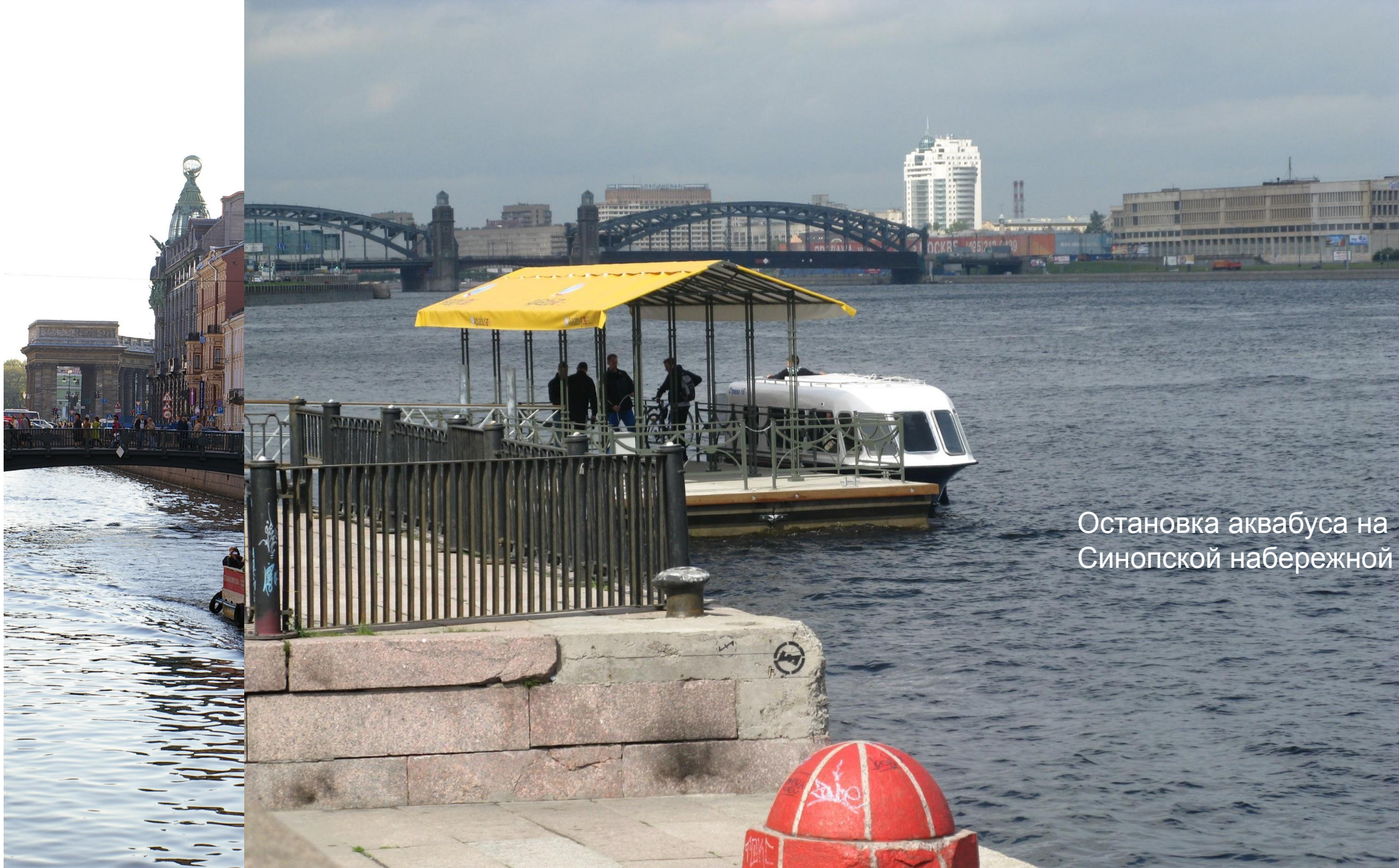
Остановка аквабуса на Синопской набережной