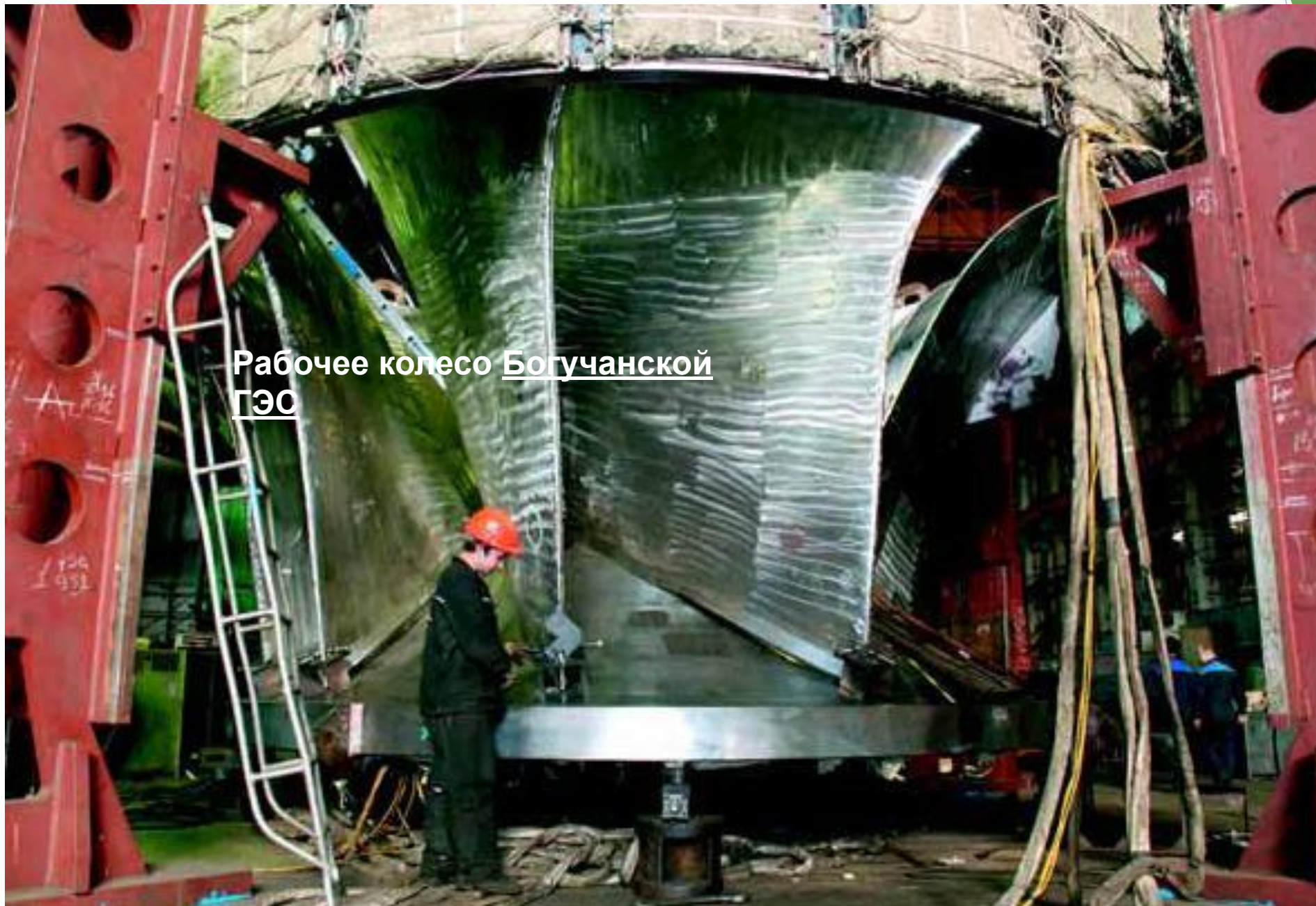
Рабочее колесо Богучанской ГЭС