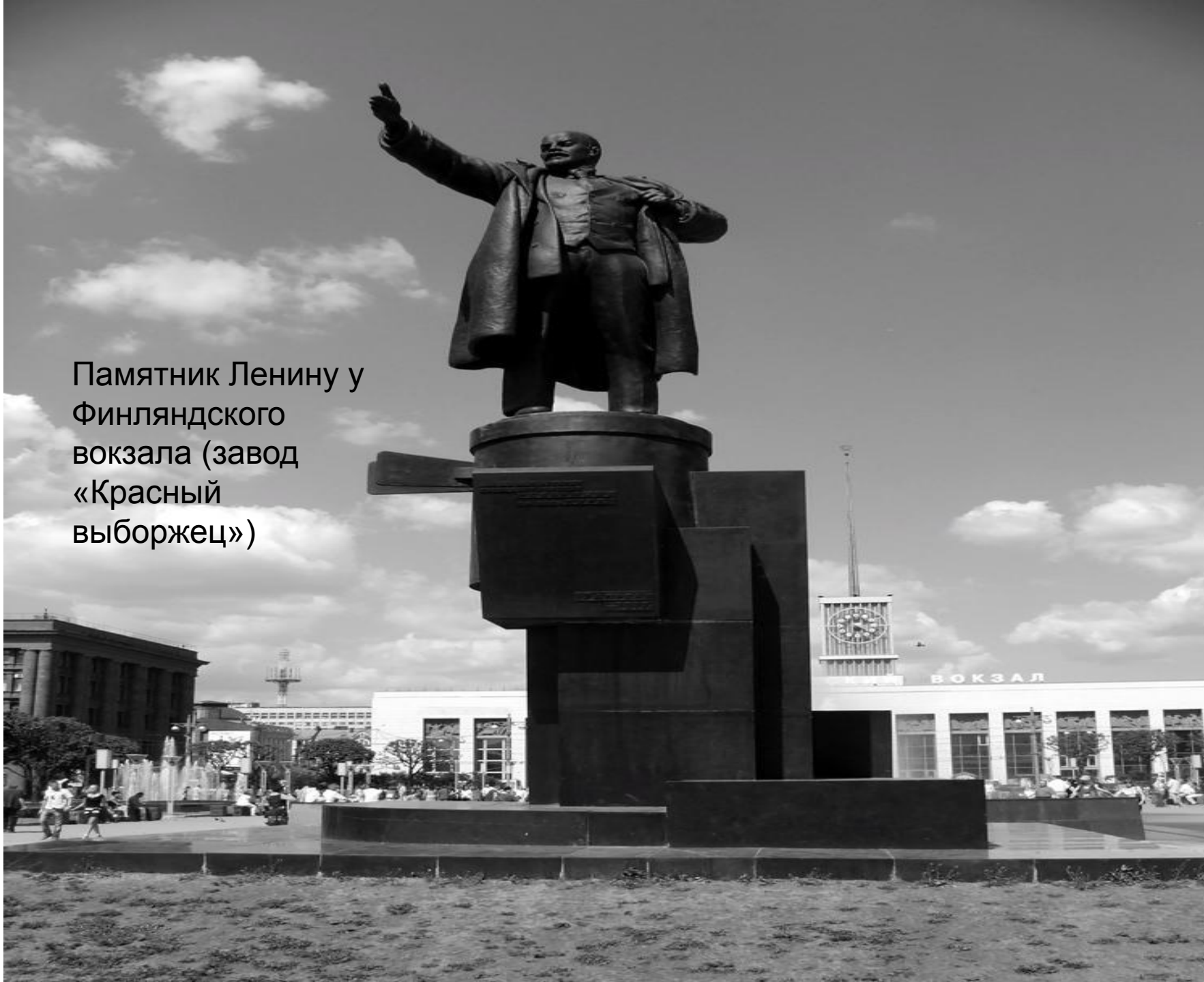
Памятник Ленину у Финляндского вокзала (завод «Красный выборжец»)