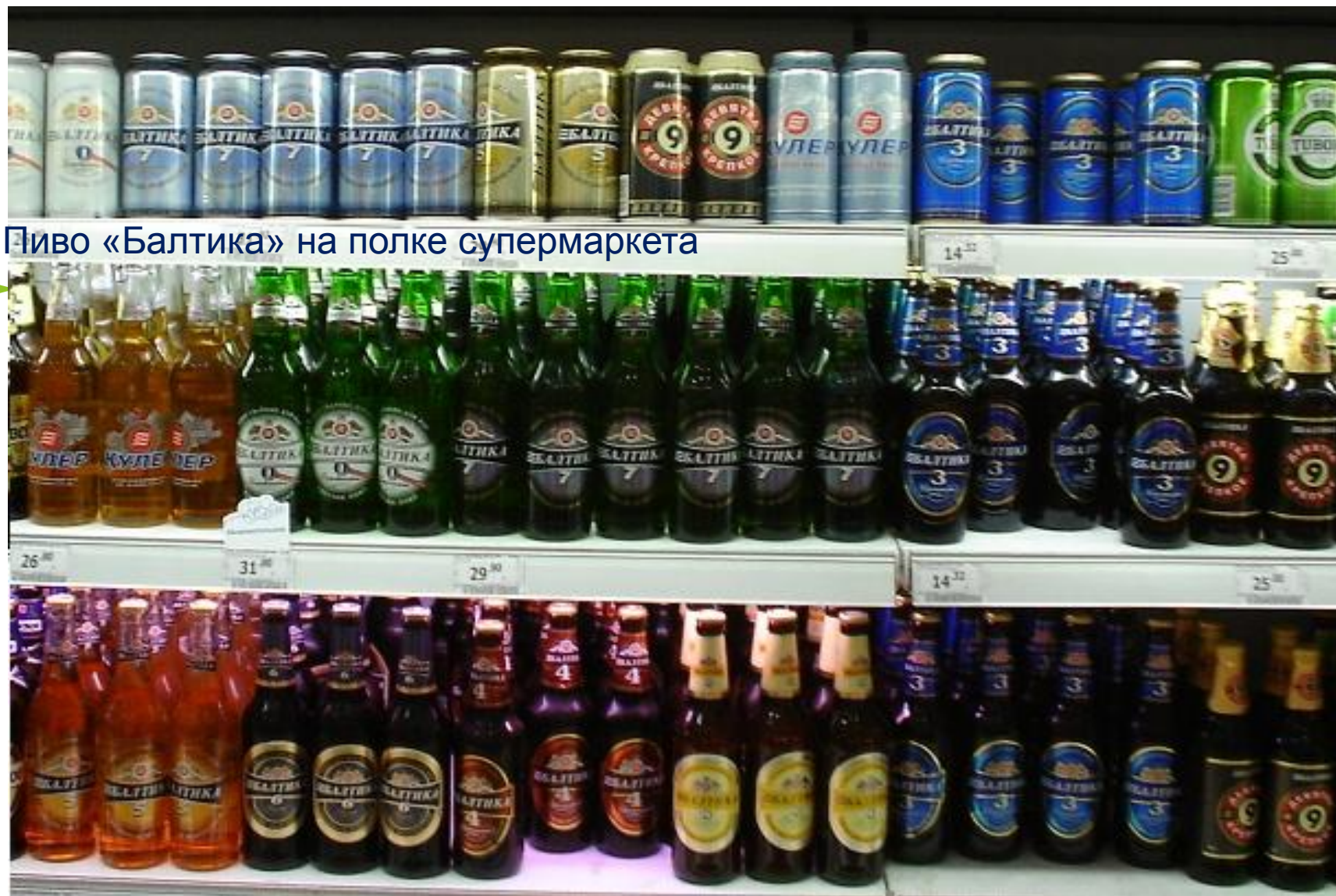
Пиво «Балтика» на полке супермаркета