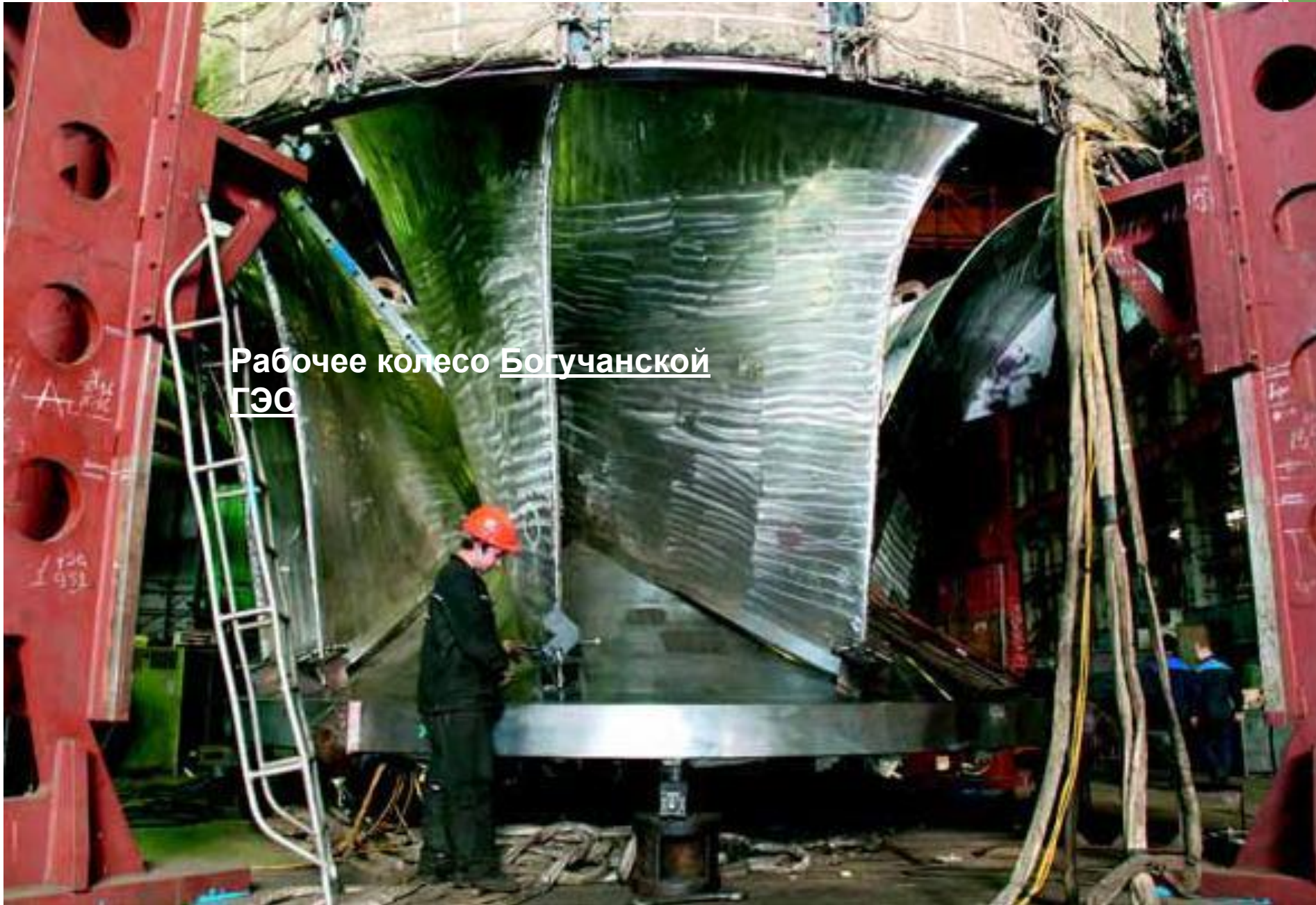
Рабочее колесо Богучанской ГЭС