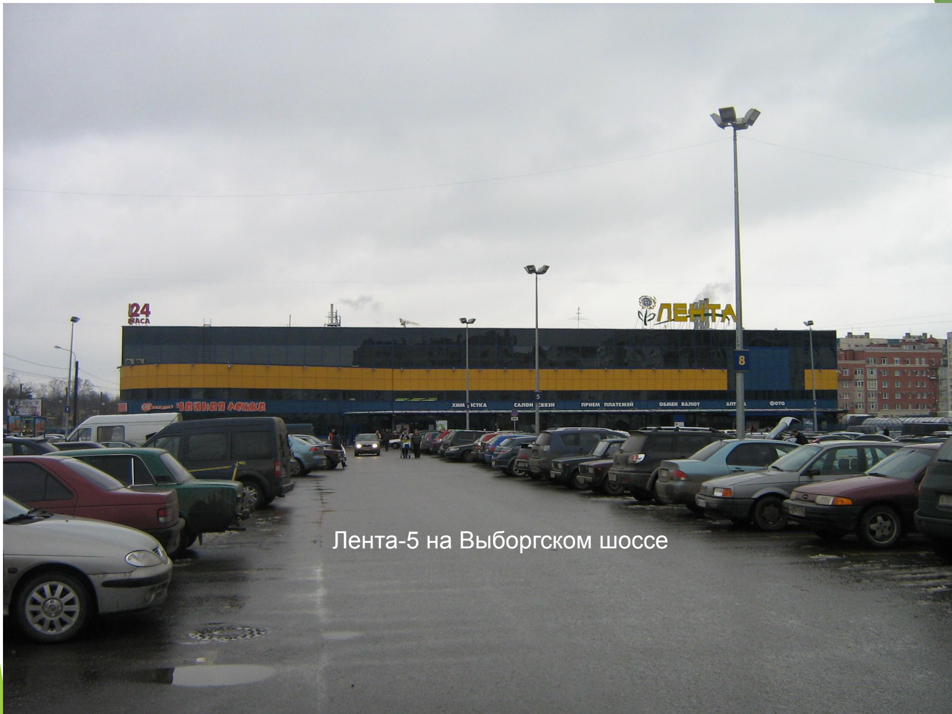
Лента-5 на Выборгском шоссе