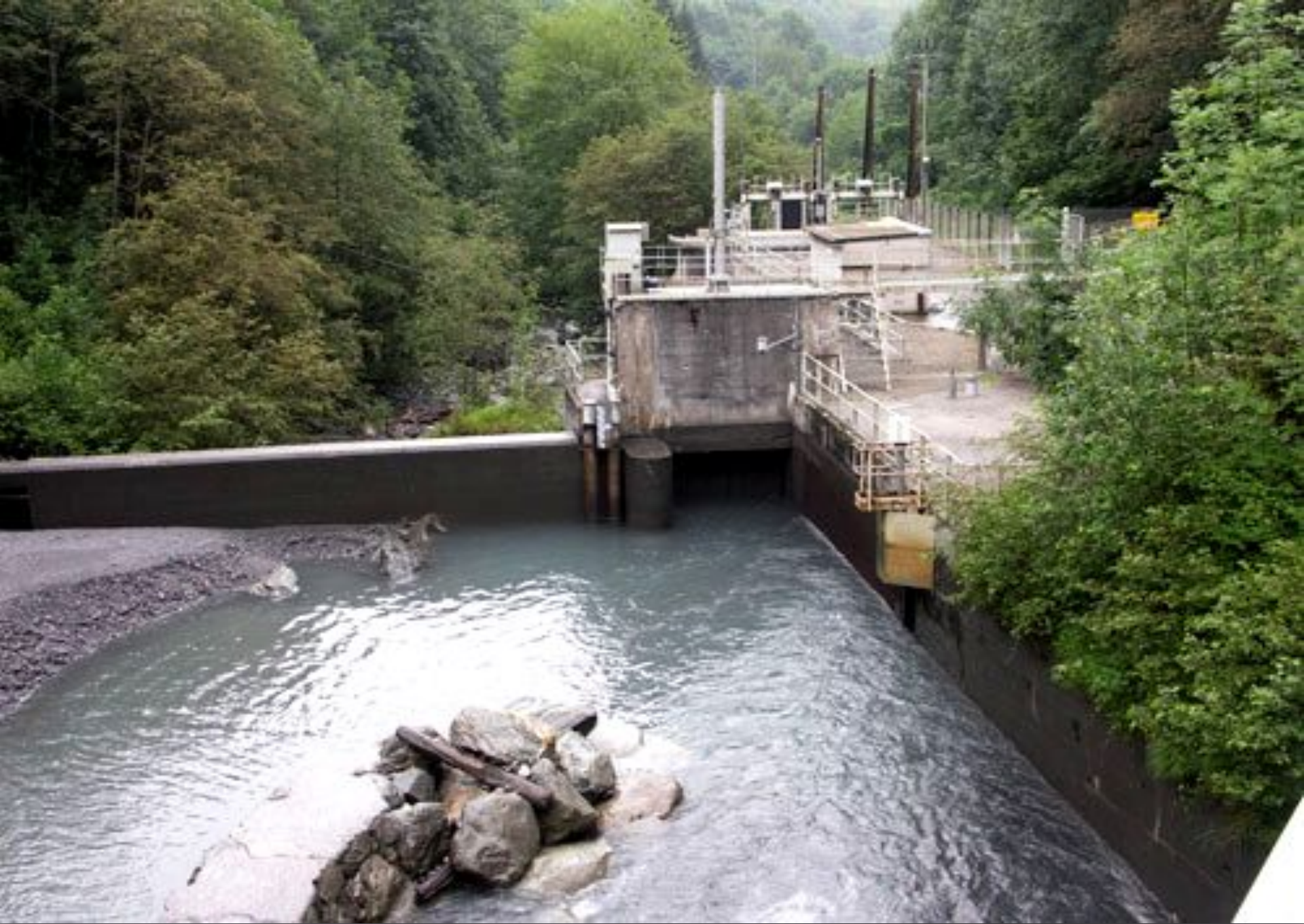
Компания «Электрисите де Франс»