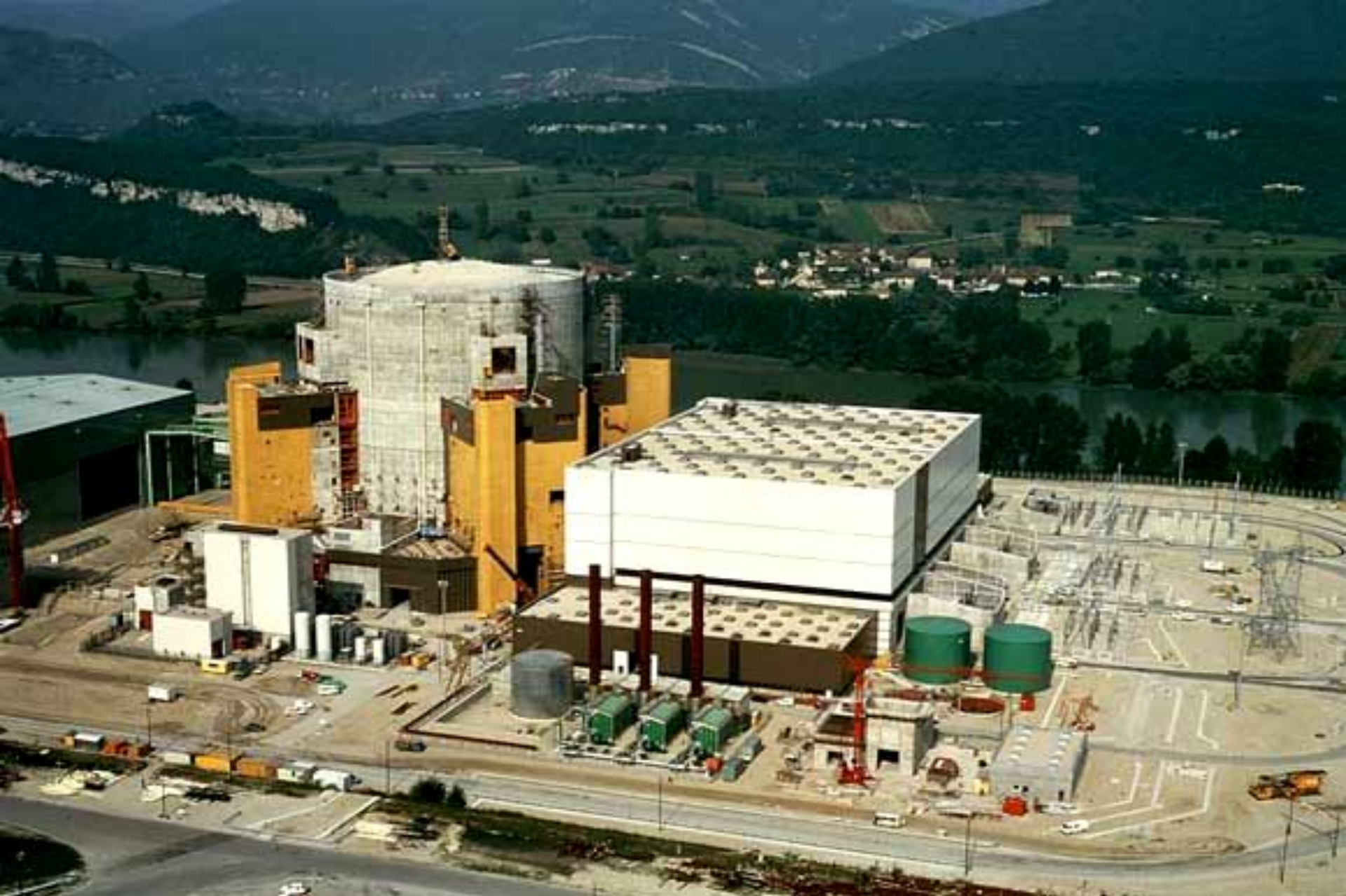
РЕАКТОР НА БЫСТРЫХ НЕЙТРОНАХ В КРЕИ-МАЛЬВИЛЬ. Промышленное производство электроэнергии на нем было прекращено по требованию защитников окружающей среды