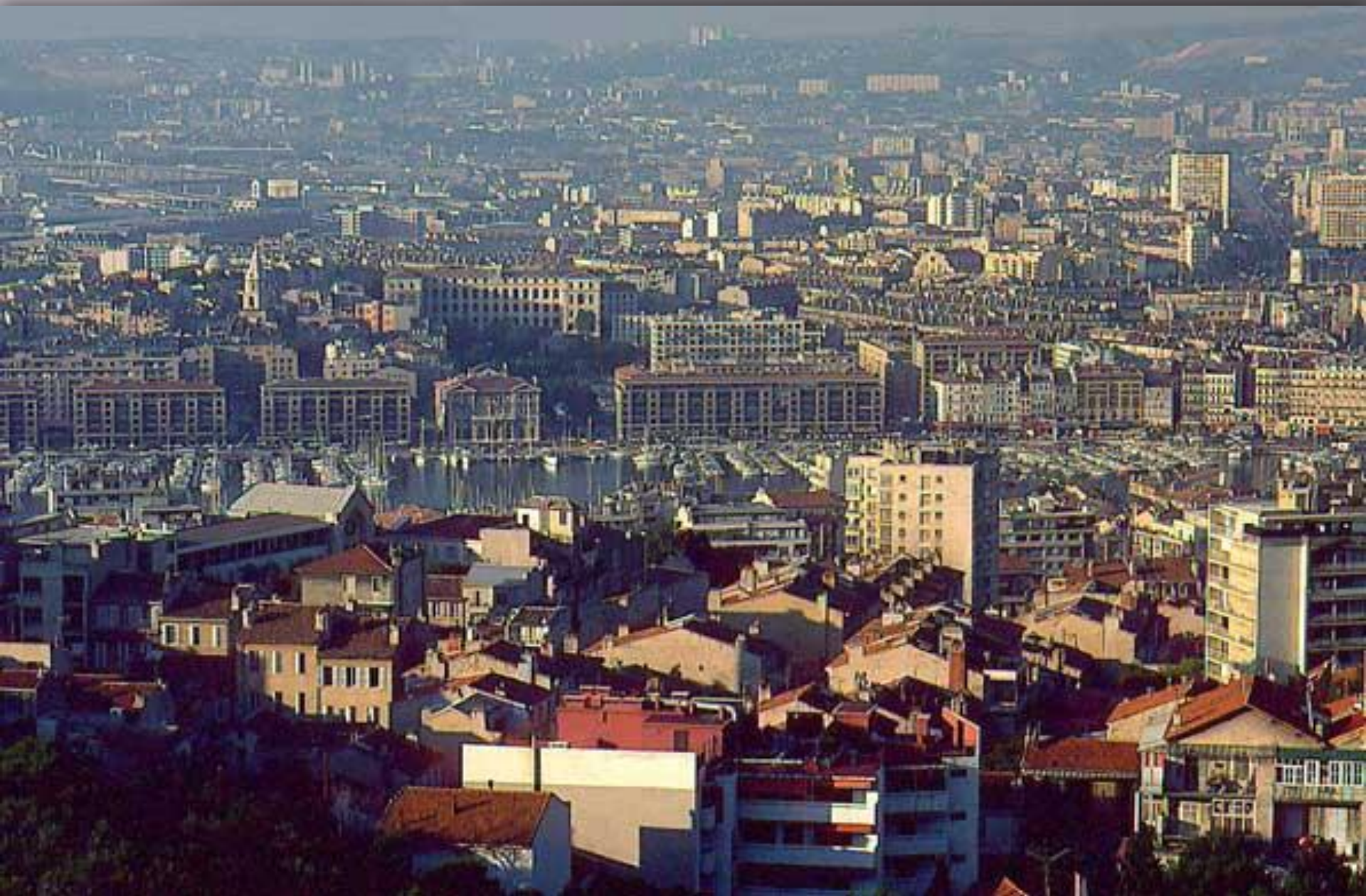
МАРСЕЛЬ, крупный портовый город на средиземноморском побережье Франции