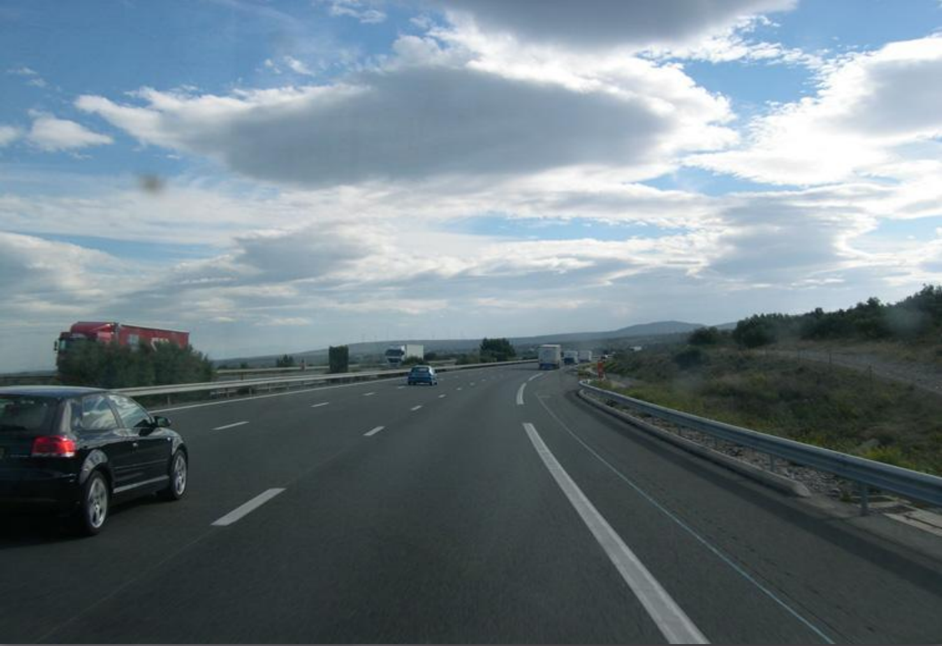
Скоростное шоссе во Франции Дата: 1 апреля, 2007