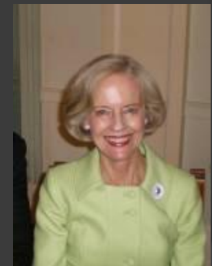
Квентин Брюс генерал-губернатор Австралии