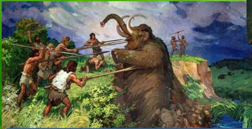
Охота на мамонта