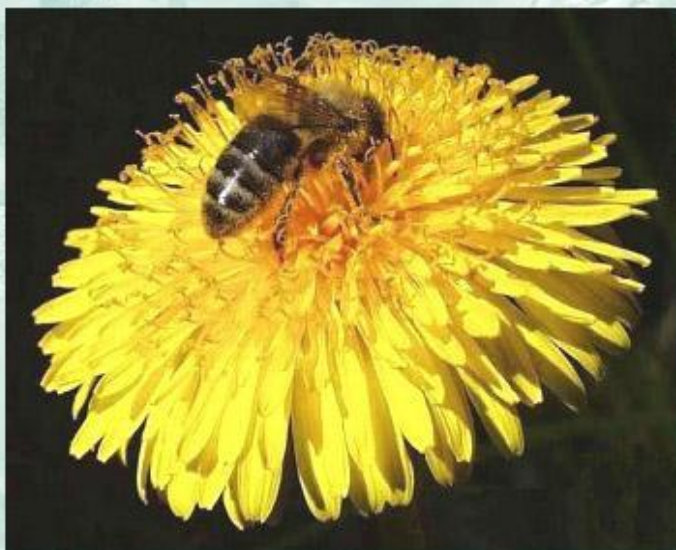
Один из примеров протокооперации - пчела, опыляющая цветок.

В природе встречается сожительство двух или более видов, при котором организмы-партнеры (или один из них) получают выгоду. Такой тип межвидовых взаимоотношений называется взаимопользными отношениями. Различают несколько форм такого сожительства живых организмов.