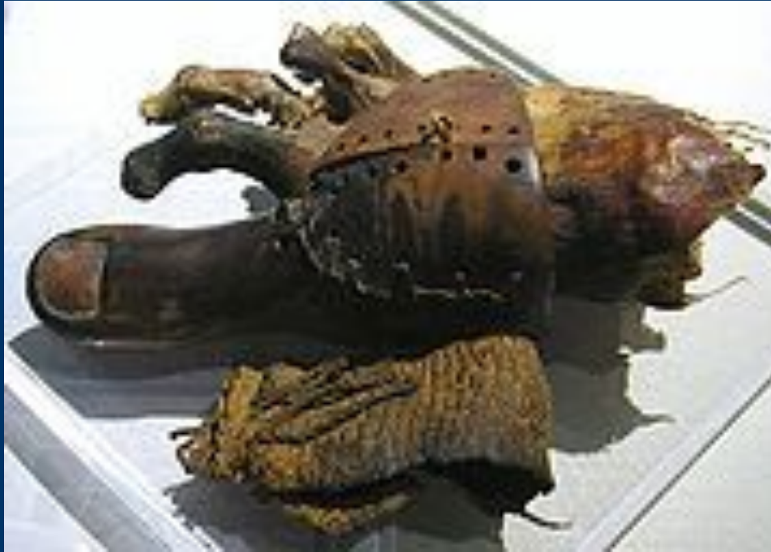
Древнеегипетский протез пальца ноги