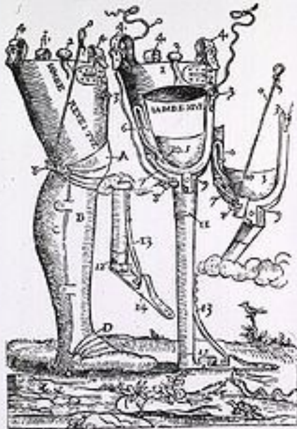
Fig. 5. Artificial leg invented by Font, from his Opera , 1774. From the copy in the Army Medical Library.