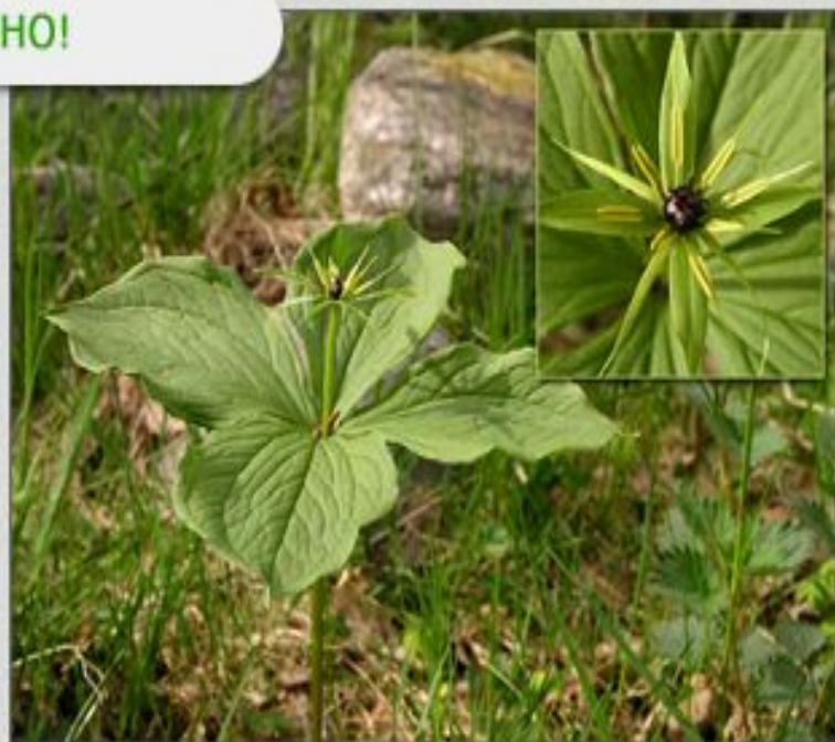
Вороний глаз – принадлежит к классу однодольные