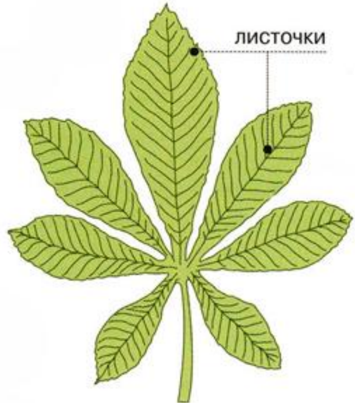
Сложный лист конского каштана.