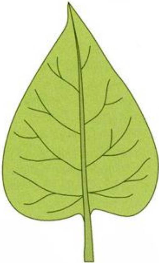
Простой лист сирени.