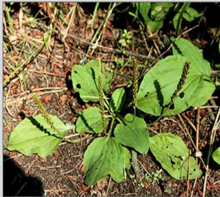
Подорожник – принадлежит к классу двудольные