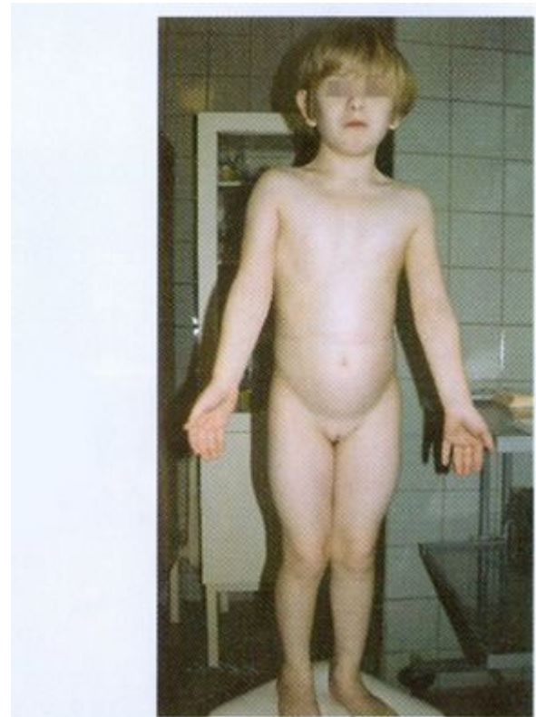
Рисунок 16. Больная 13 лет. Синдром Шерешевского-Тернера. Низкий рост, отсутствие вторичных половых признаков