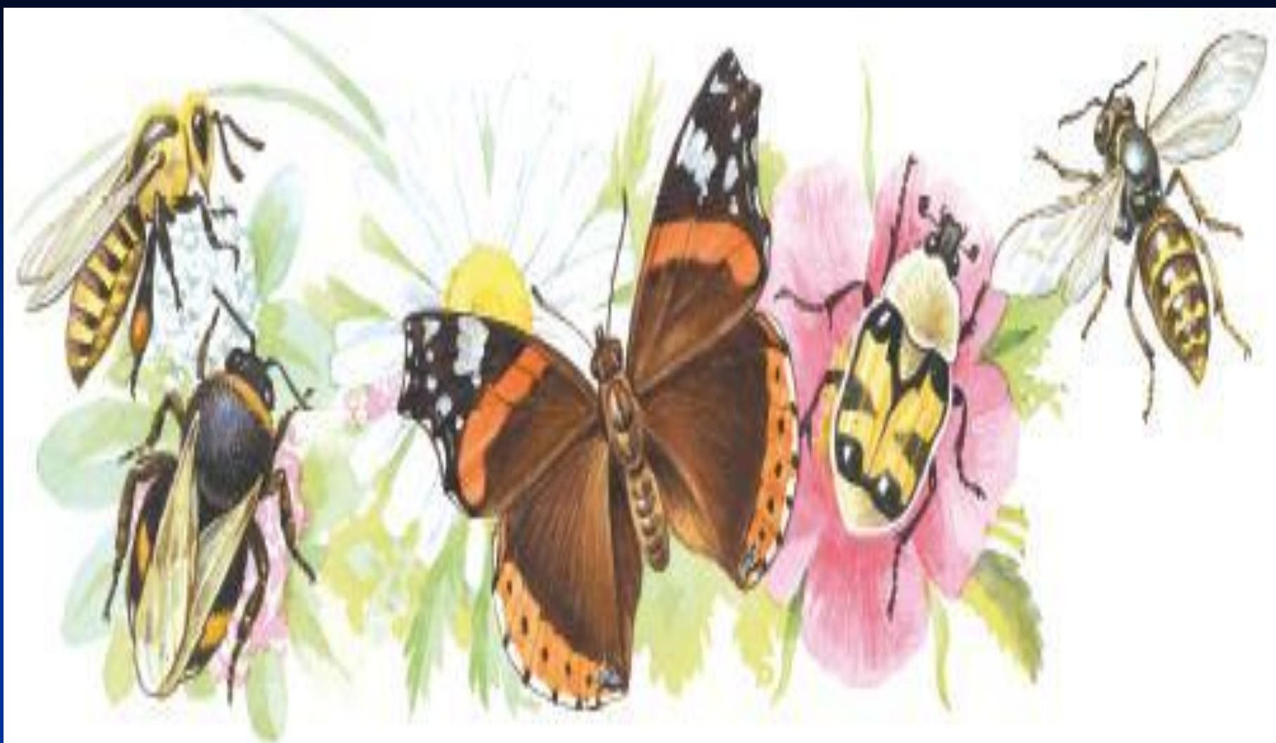
Рис. 4. Насекомые – опылители растений