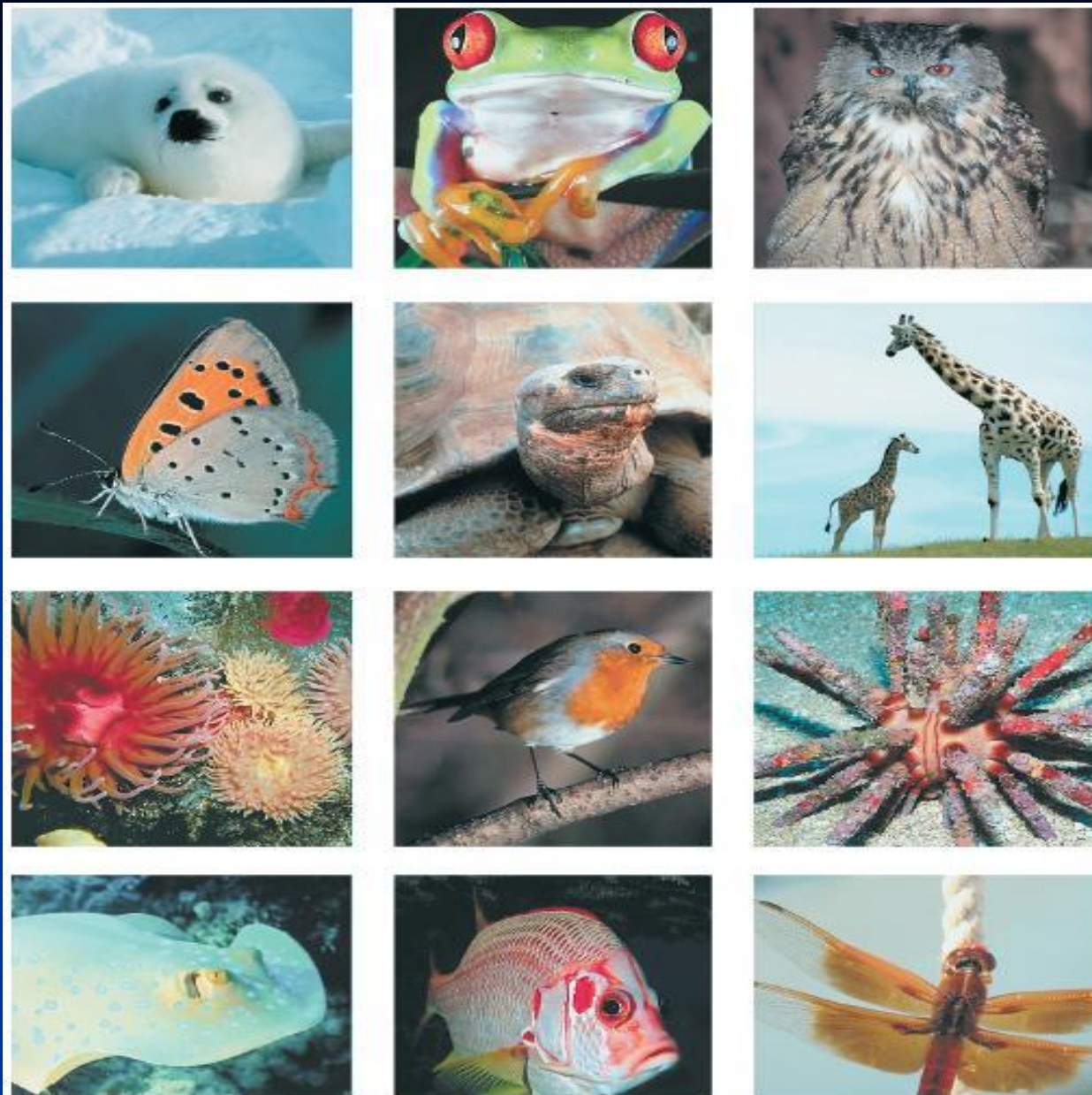
Рис. 1. Многообразие многоклеточных животных