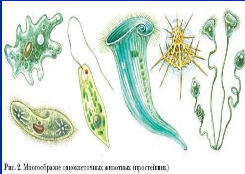
Рис. 2. Многообразие одноклеточных животных (простейших)