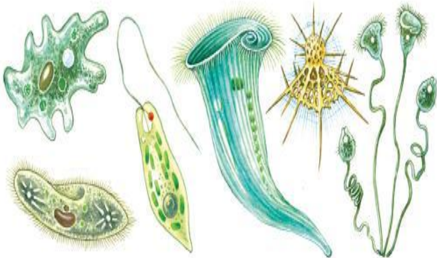
Рис. 2. Многообразие одноклеточных животных (простейших)