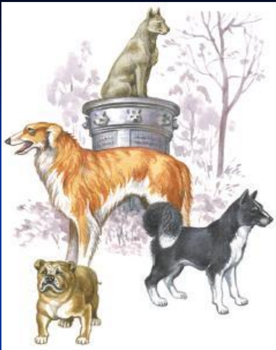
Рис. 6. Породы собак и памятник собаке