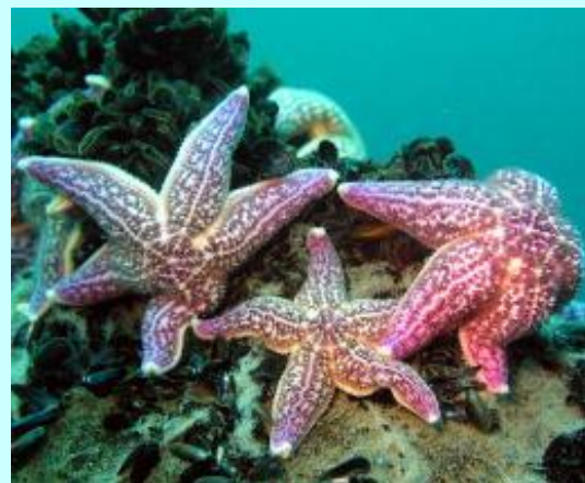
Обыкновенная амурская звезда