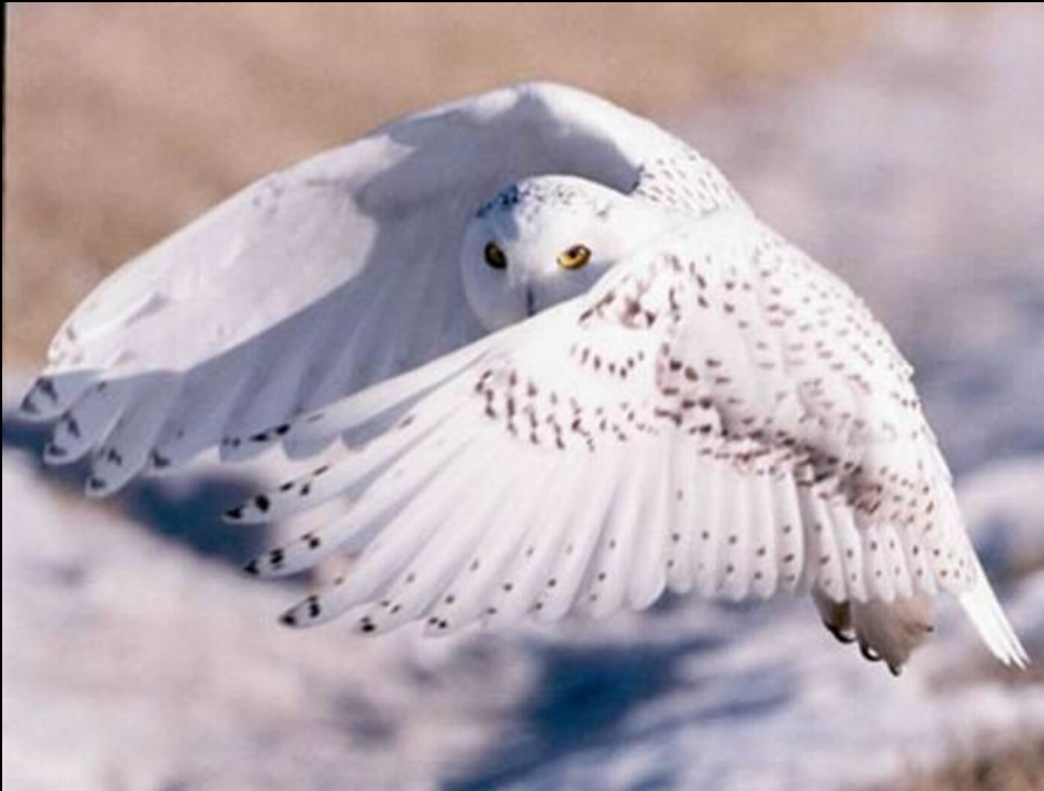
вид сова полярная

1. Развитие представлений о ВИДЕ – вид реально существующая группа организмов, по представлениям данного учёного